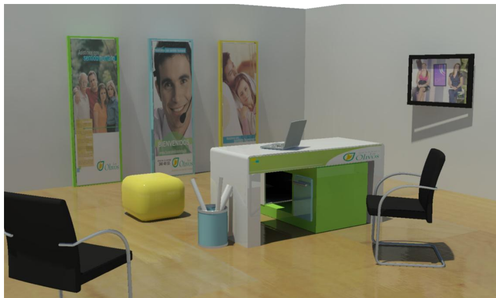
Figura 1 Propuesta Seleccionada