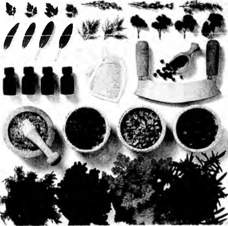
Hierbas de todos los estilos y con múltiples aplicaciones. Las hay para adornar, aromatizar, refrescar y aliviar.

Por MARGARITAINÉS RESTREPO SANTA ANA Medellín