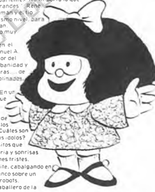
Mafalda, por sus respuestas.

No hay dirigentes. Este país es tierra de nadie. Detrás de las respuestas que nos dieron los chicos de los adultos, está el