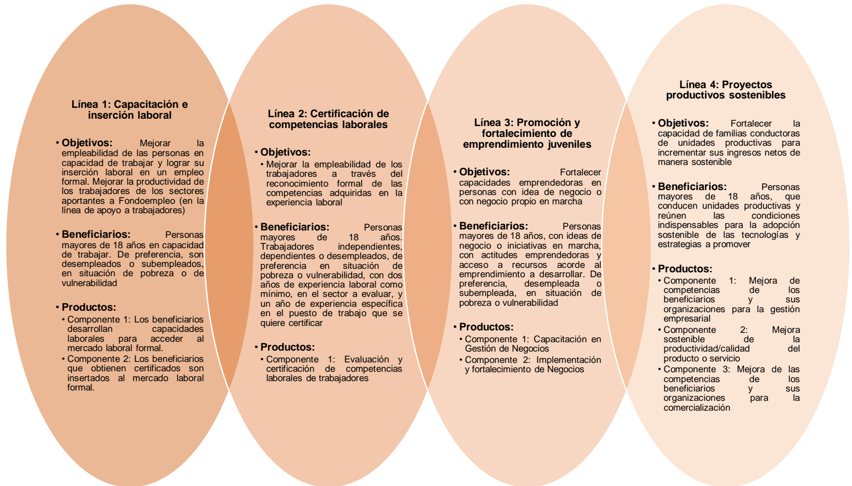
Diagrama 2: Líneas concursales de Fondoempleo (modelo actual)