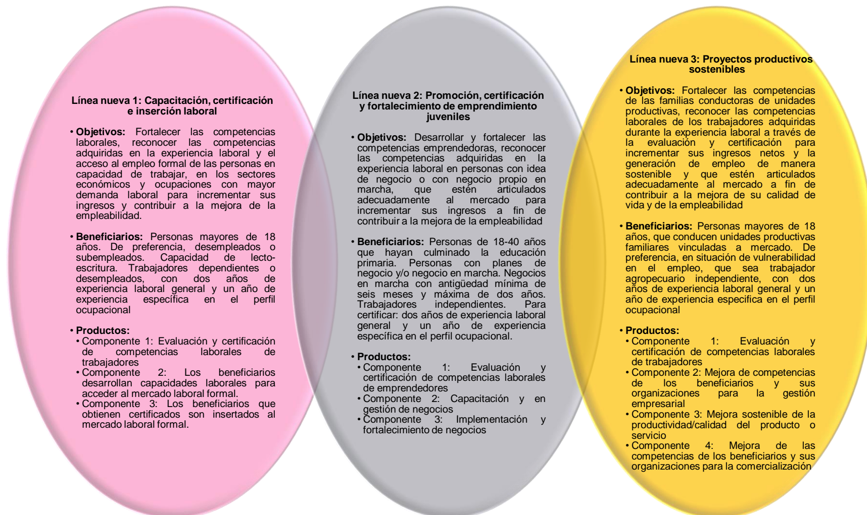
Diagrama 1: Propuesta de líneas concursales de Fondoempleo