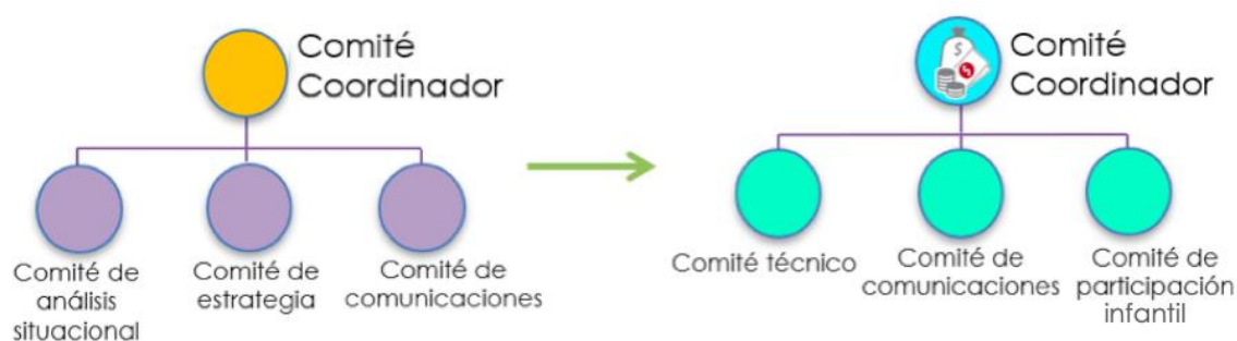
Figura 1: Modificación de la estructura interna de NiñezYa

Por otro lado, se definió una estructura de comités para llevar a cabo las tareas y actividades que surgen de las labores de la red. En principio, se destaca el momento de la división de funciones a través de la creación de cuatro comités que buscó asignar funciones y tareas dependiendo de necesidades puntuales de la estrategia; finalmente esa estructura se modificó a tres 19 . En la siguiente figura se muestra la transformación entre la estructura planeada en los inicios de la estrategia en junio de 2017, a lo que finalmente se acordó según las necesidades en agosto de 2018.