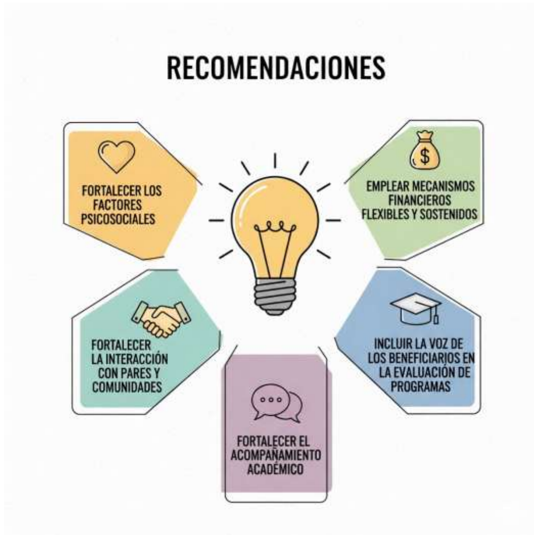
Figura 3. Recomendaciones para el fortalecimiento de las políticas de apoyo educativo

Nota. Figura generada en Géminis IA a partir de los hallazgos de esta investigación.