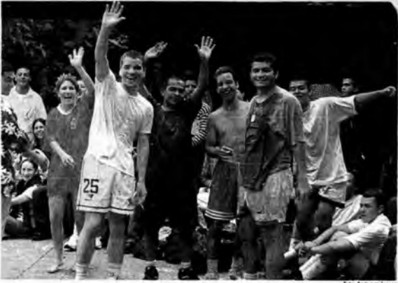
Aledor de los 14 años los muchachos son más optimistas. Sin embargo, cuando se convierten en adultos jóvenes dicho optimismo decae. Las dificultades para encontrar empleo pueden estar entre las causas de este fenómeno.

NO SON optimistas pero consideran que su vida va bien encaminada. Reconocen la existencia de la droga y el alcohol. Su familia es prioridad. Los muchachos colombianos hablaron de sí mismos.