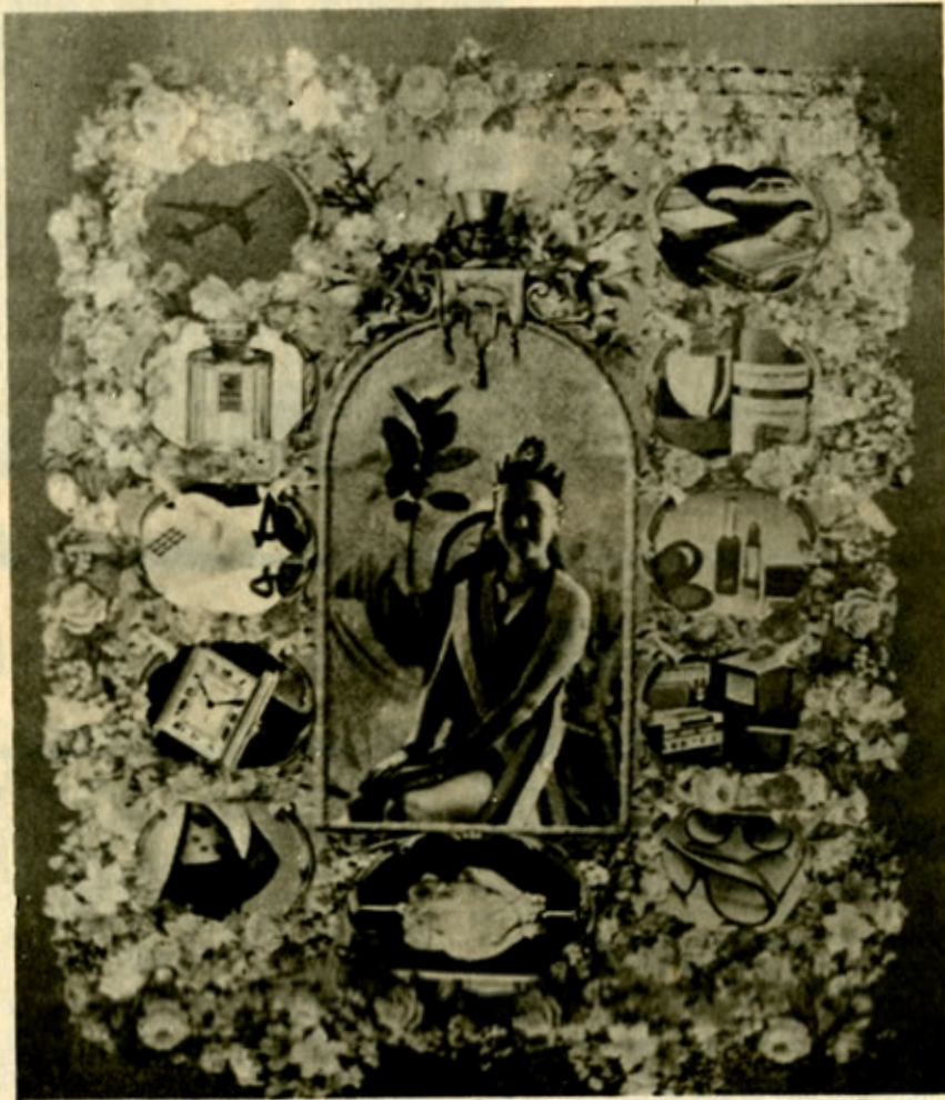
"La Miss". (Foto de Jorge Zuleta).