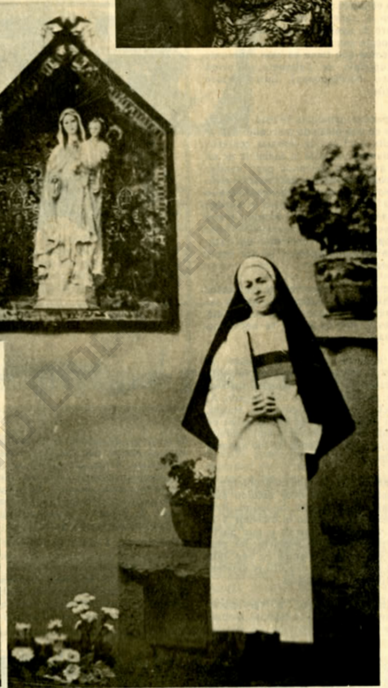
"La Madre Patria". (Foto de Jorge Zuleta).