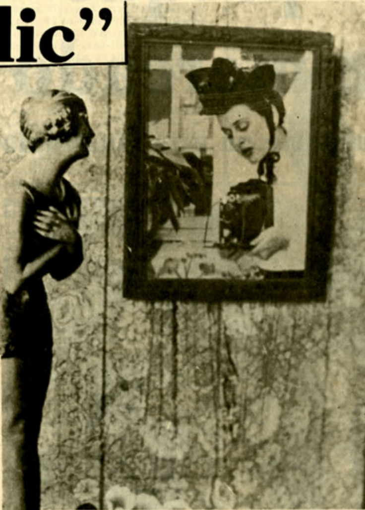
"Lady Kodak". (Foto de Jorge Zuleta).