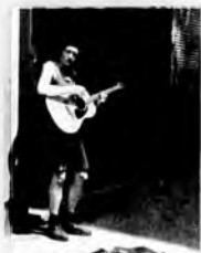
Foto Margaritanes Restrepo Santa María Irlanda vive un boom, pero, también, la preocupación de aguandar la brecha entre las que tienen y las que tienen dificultades económicas. Y hay cabida para las actividades del rebuque, con música de gaélico.