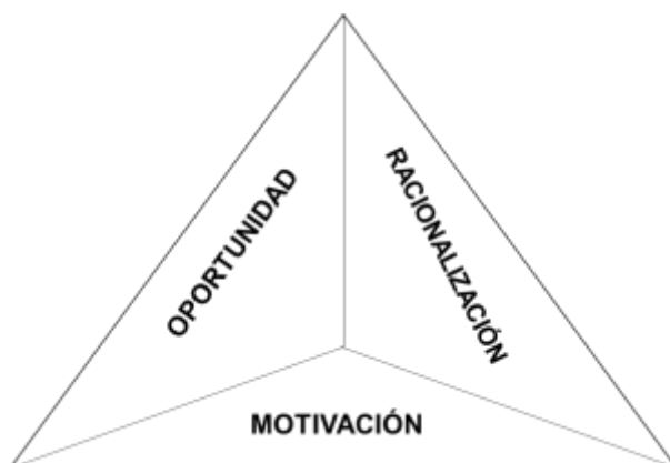
Ilustración 1. El triángulo de riesgos