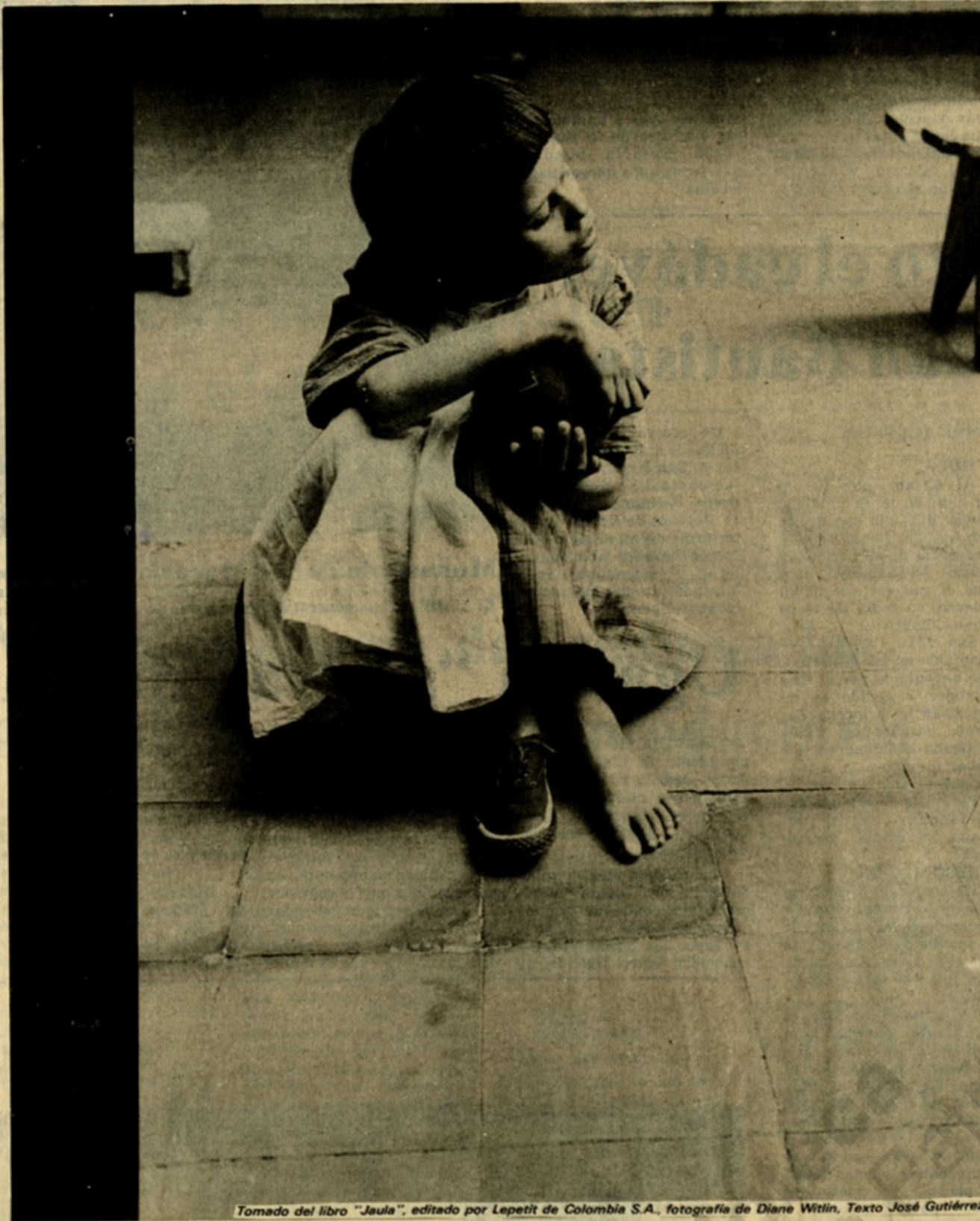
Tomado del libro "Jaula", editado por Lepetit de Colombia S.A., fotografía de Diane Wittlin, Texto José Gutiérrez

Quién me mostrará el futuro? Incógnita sencilla. Lujosa diferencia del animal y el hombre jamás habrá respuesta a la pregunta