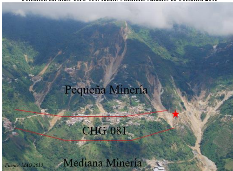
Ubicación del título CHG-081: fuente: Minerales Andinos de Occidente 2013

Con el transcurso del tiempo y ante la realidad social de la zona, las personas cambiaron y los nuevos actores fueron los que interpusieron la acción de tutela para proteger su derecho al trabajo, al mínimo vital, entre otros. El Juez Penal del Circuito de Riosucio en primera instancia negó las pretensiones de la acción, decisión que fue confirmada por la Sala de Decisión Penal del Tribunal Superior de Manizales, ante respuesta del recurso interpuesto por los accionantes. La tutela llegó a la Corte Constitucional donde se dictó la sentencia T-438 de 2015 M.P. Jorge Ignacio Pretelt Chaljub amparando el derecho a la consulta previa de las comunidades indígenas Cartama y de la