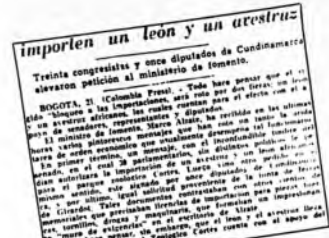
Ahí están plátanos El Colombiano, noviembre 22 de 1962.