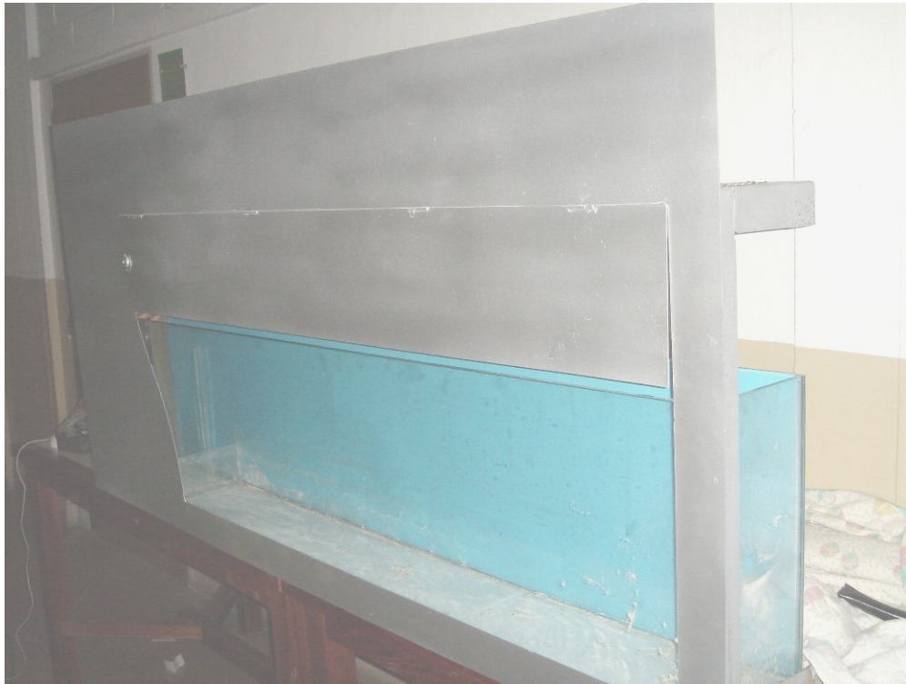
Acuario dentro de la estructura