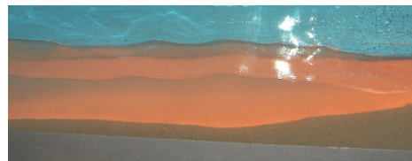
Oleaje y luz de la tarde