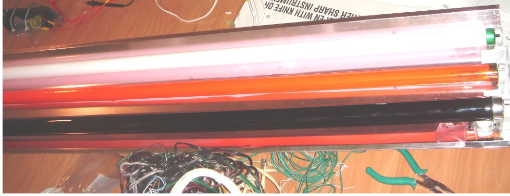
Ensamble Sistema Iluminación

Pantalla de aluminio espejante, luz negra y dos luces blancas (una con filtro naranjado)