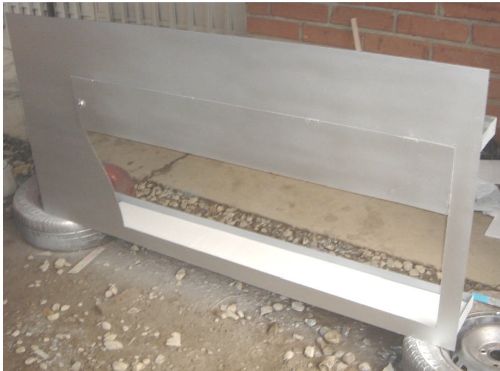
Estructura por el frente - proceso de pintado