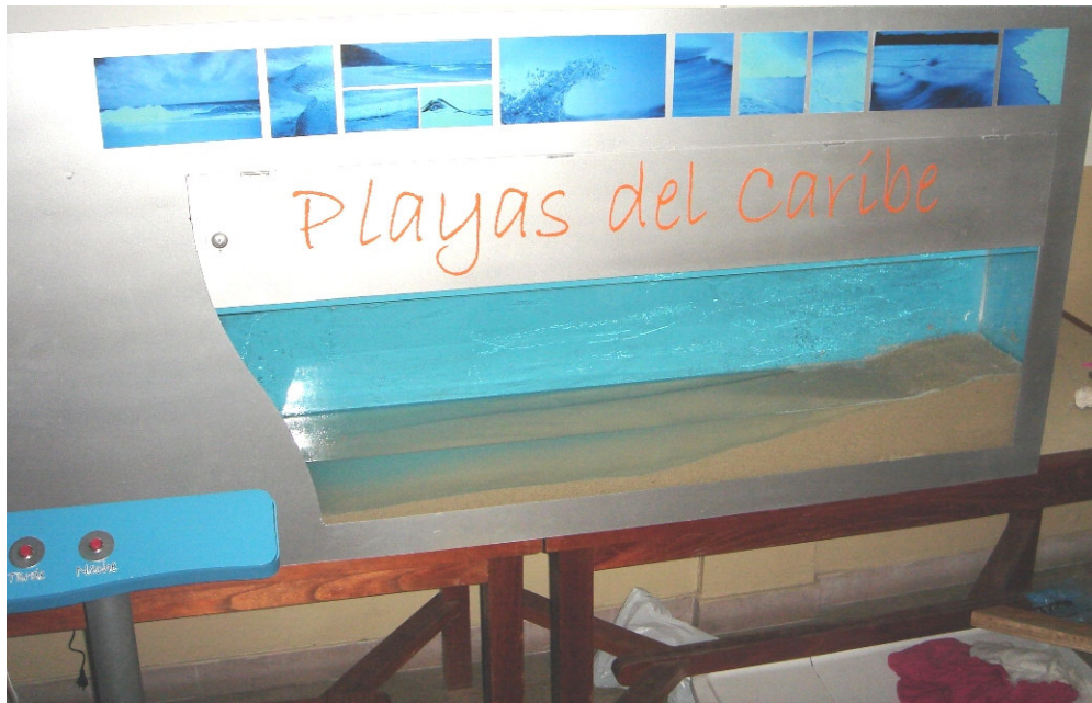
Acuario dentro de la estructura, playa en arena, nombre de la máquina, fotos de ambientación, caja pulsadores