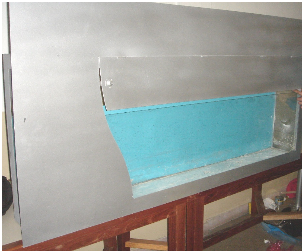
Acuario dentro de la estructura