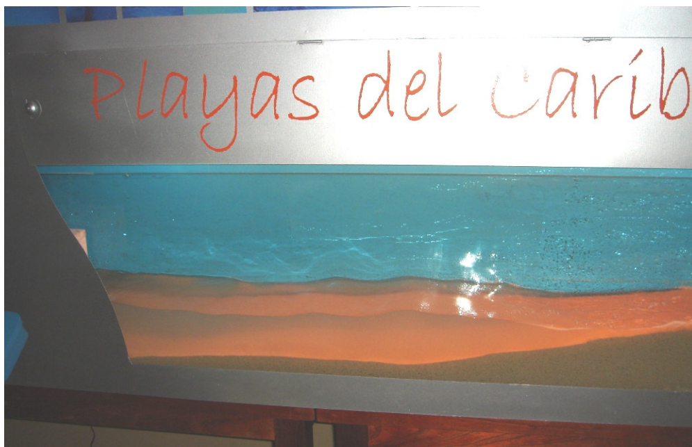
Máquina en funcionamiento - TARDE