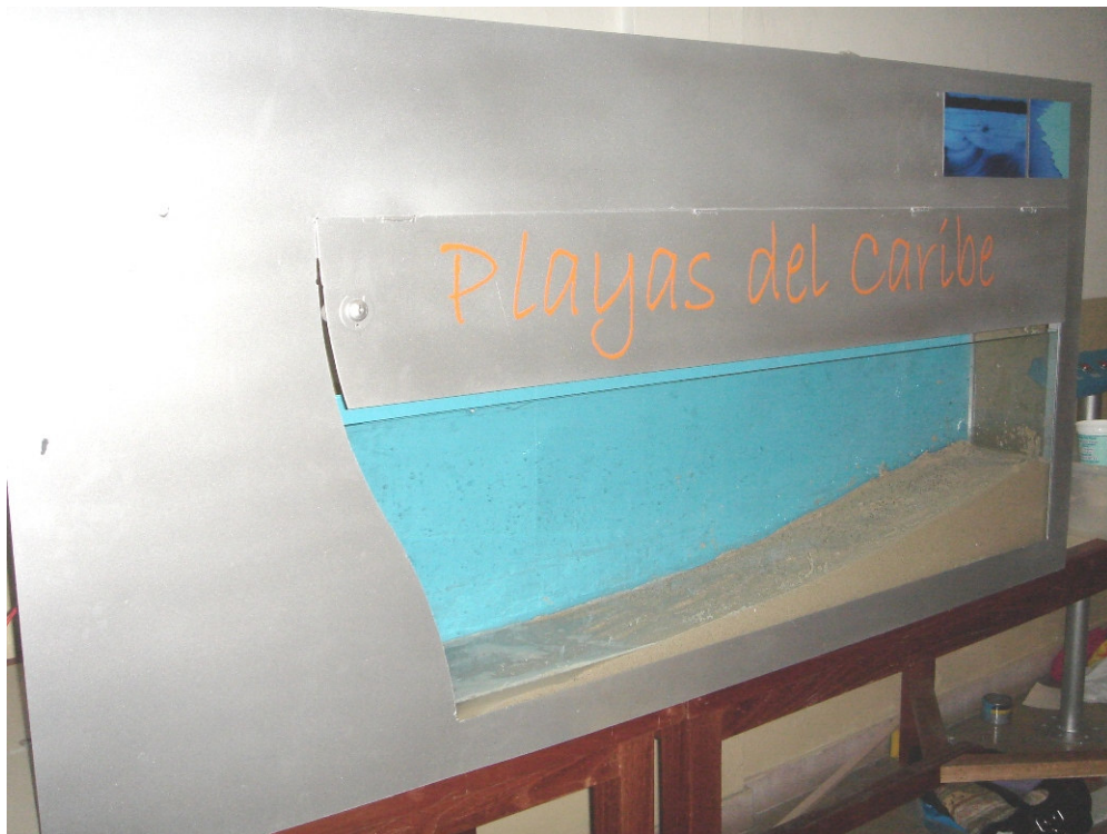
Acuario dentro de la estructura, playa en arena, nombre de la máquina y fotos de ambientación