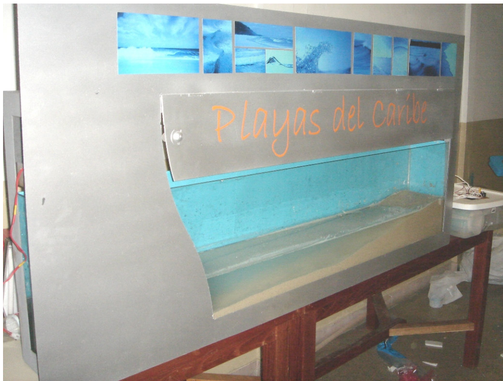
Acuario dentro de la estructura, playa en arena, nombre de la máquina y fotos de ambientación