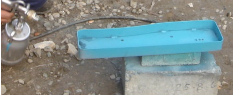
Caja pulsadores - proceso de pintado