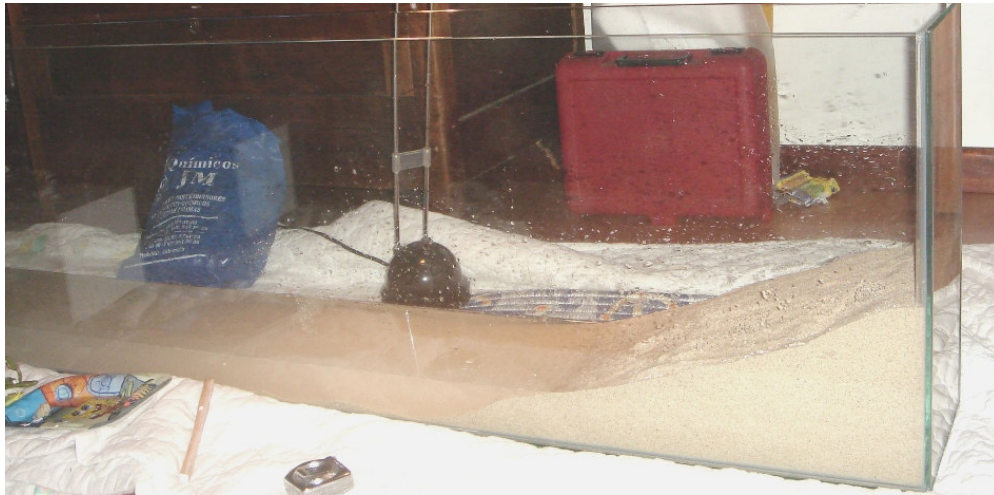
Acuario con agua y arena