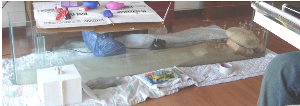
Acuario con agua y arena