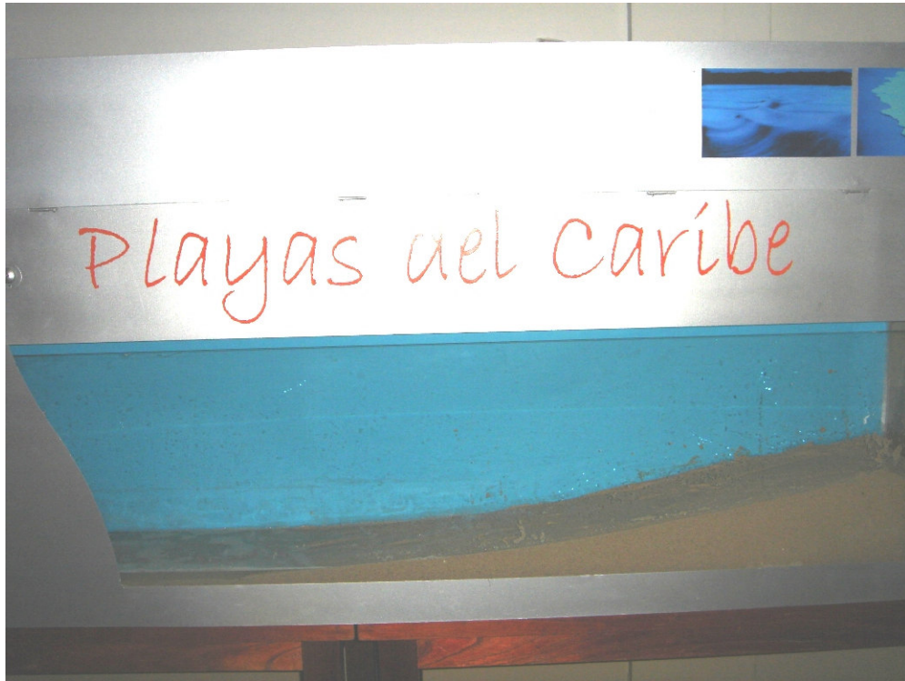
Acuario dentro de la estructura, playa en arena, nombre de la máquina y fotos de ambientación