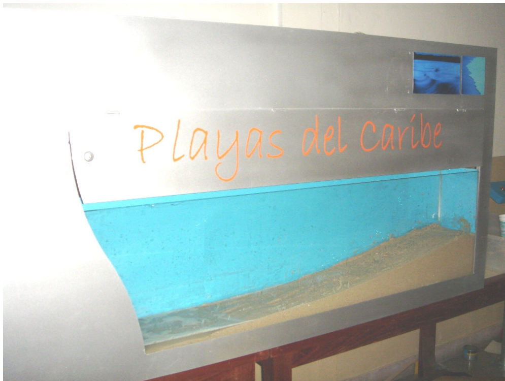
Acuario dentro de la estructura, playa en arena, nombre de la máquina y fotos de ambientación