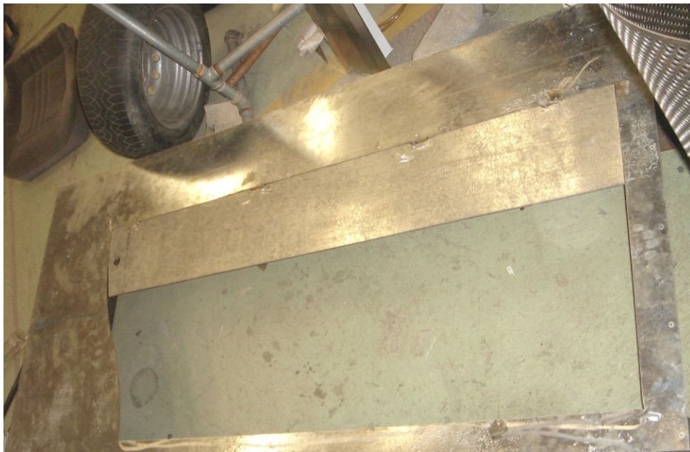
Estructura por el frente sin pintar