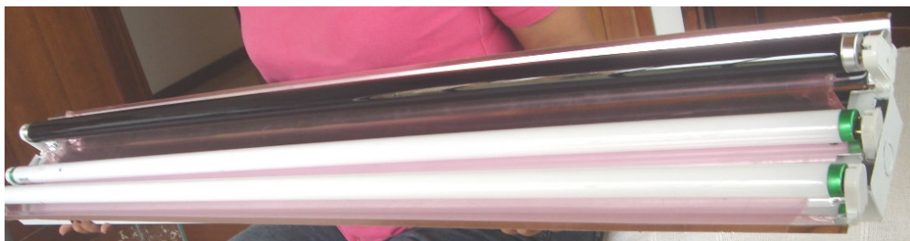
Ensamble Sistema Iluminación Pantalla de aluminio especular, luz negra y dos luces blancas