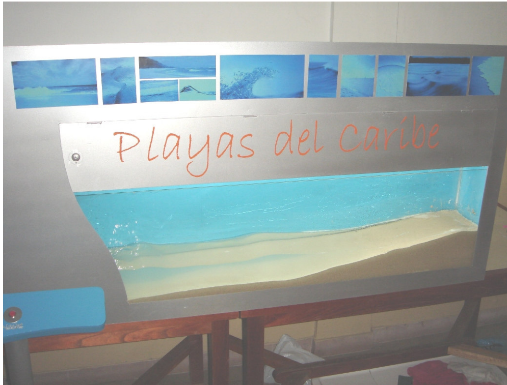
Máquina en funcionamiento - MAÑANA