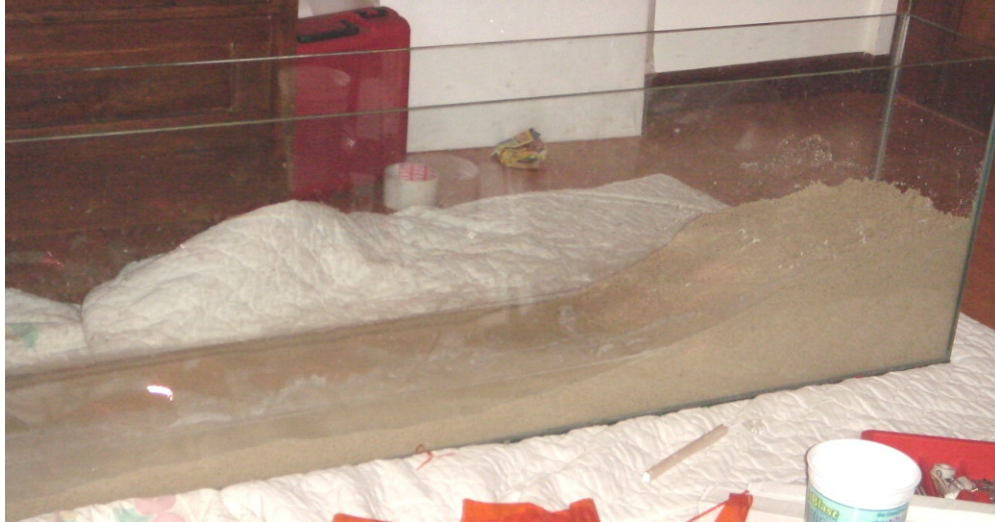
Acuario con agua y arena