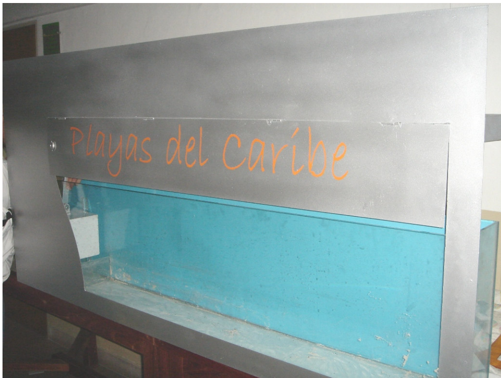
Acuario dentro de la estructura y nombre de la máquina