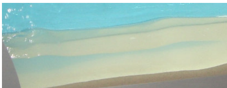
Oleaje y luz de la mañana