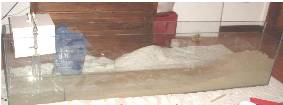
Acuario con agua, arena y cubo