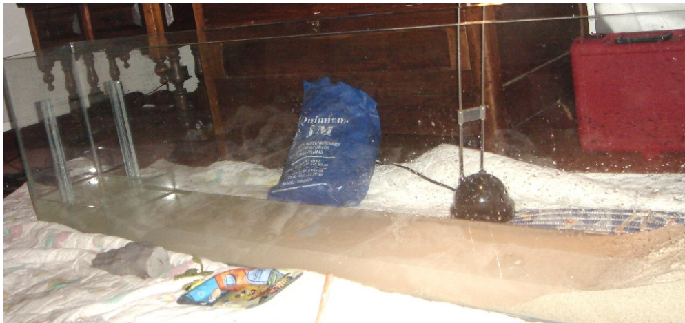
Acuario con agua y arena