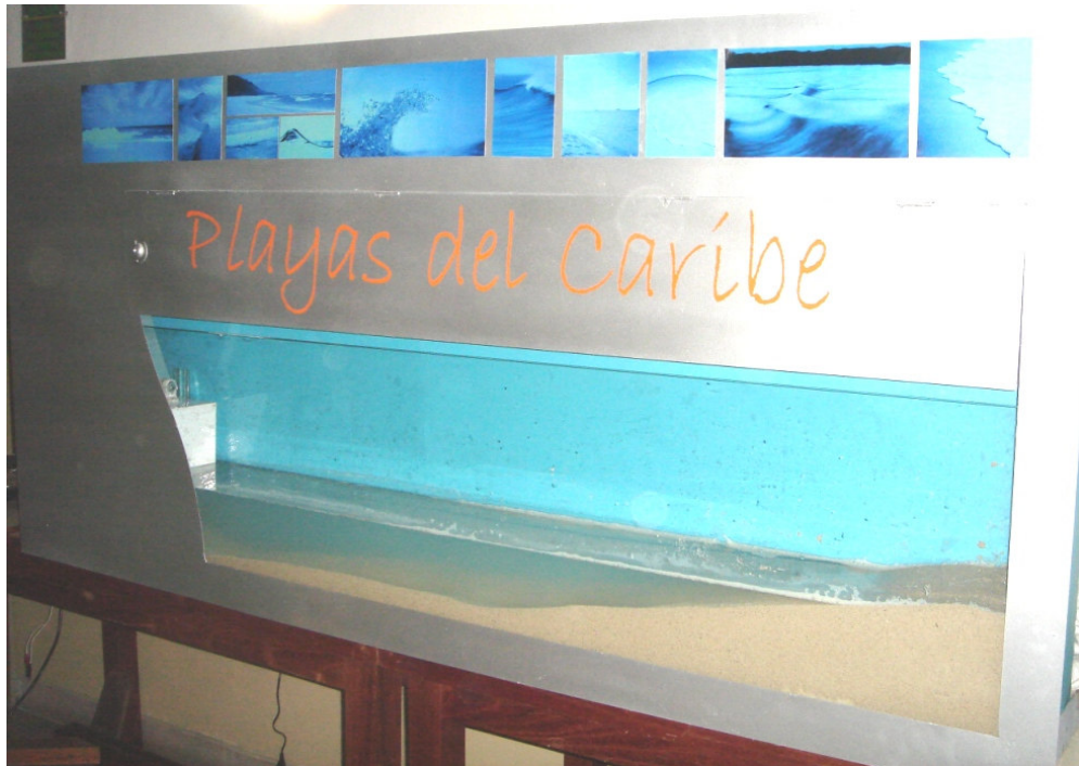
Acuario dentro de la estructura, playa en arena, nombre de la máquina y fotos de ambientación