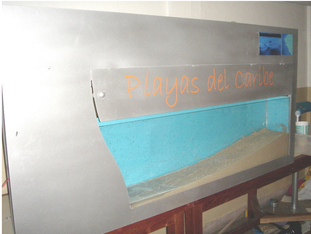
Acuario dentro de la estructura, playa en arena, nombre de la máquina y fotos de ambientación