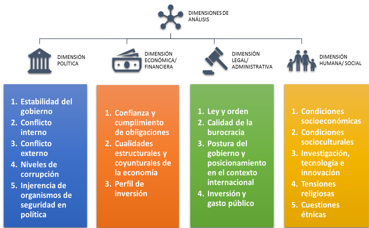
Figura 2. Dimensiones de análisis del riesgo político

La figura 2 presenta un esquema consolidado de las dimensiones consideradas para la evaluación del riesgo político en el medio organizacional nacional y transnacional.