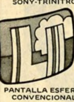
PANTALLA ESFERICA CONVENCIONAL