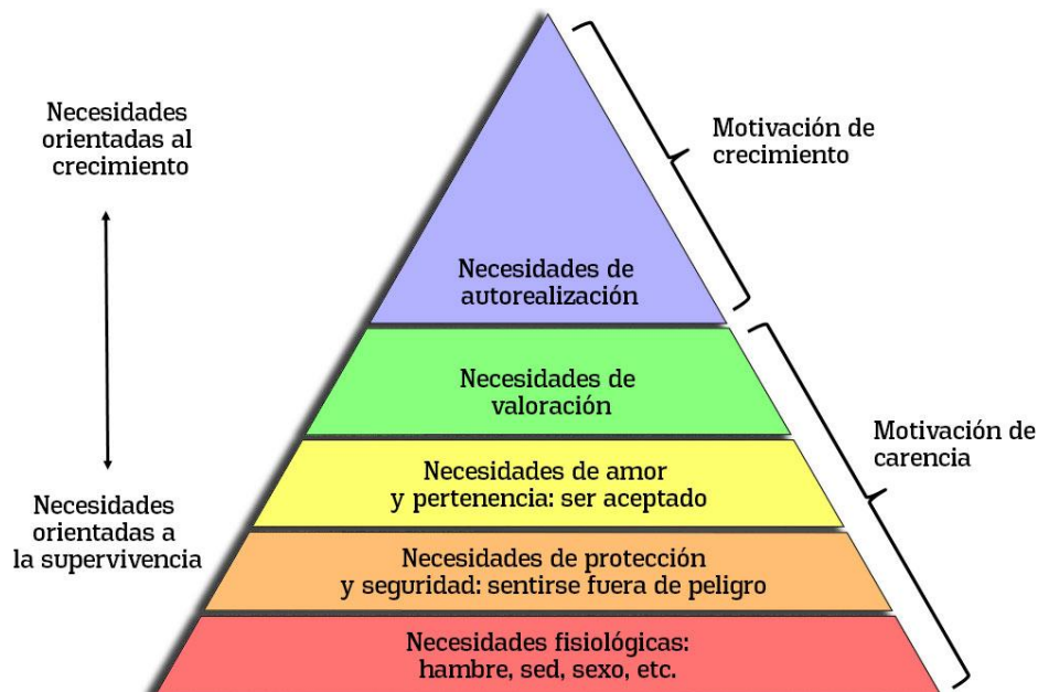
Ilustración Pirámide de Maslow. Navarro, 2019

La pirámide de las necesidades humanas o pirámide de Maslow, es una teoría propuesta por Abraham Maslow en 1943, en un ensayo de su autoría titulado “Una teoría sobre la motivación humana”, aquí el jerarquiza y prioriza las necesidades humanas y las organiza de la siguiente manera: