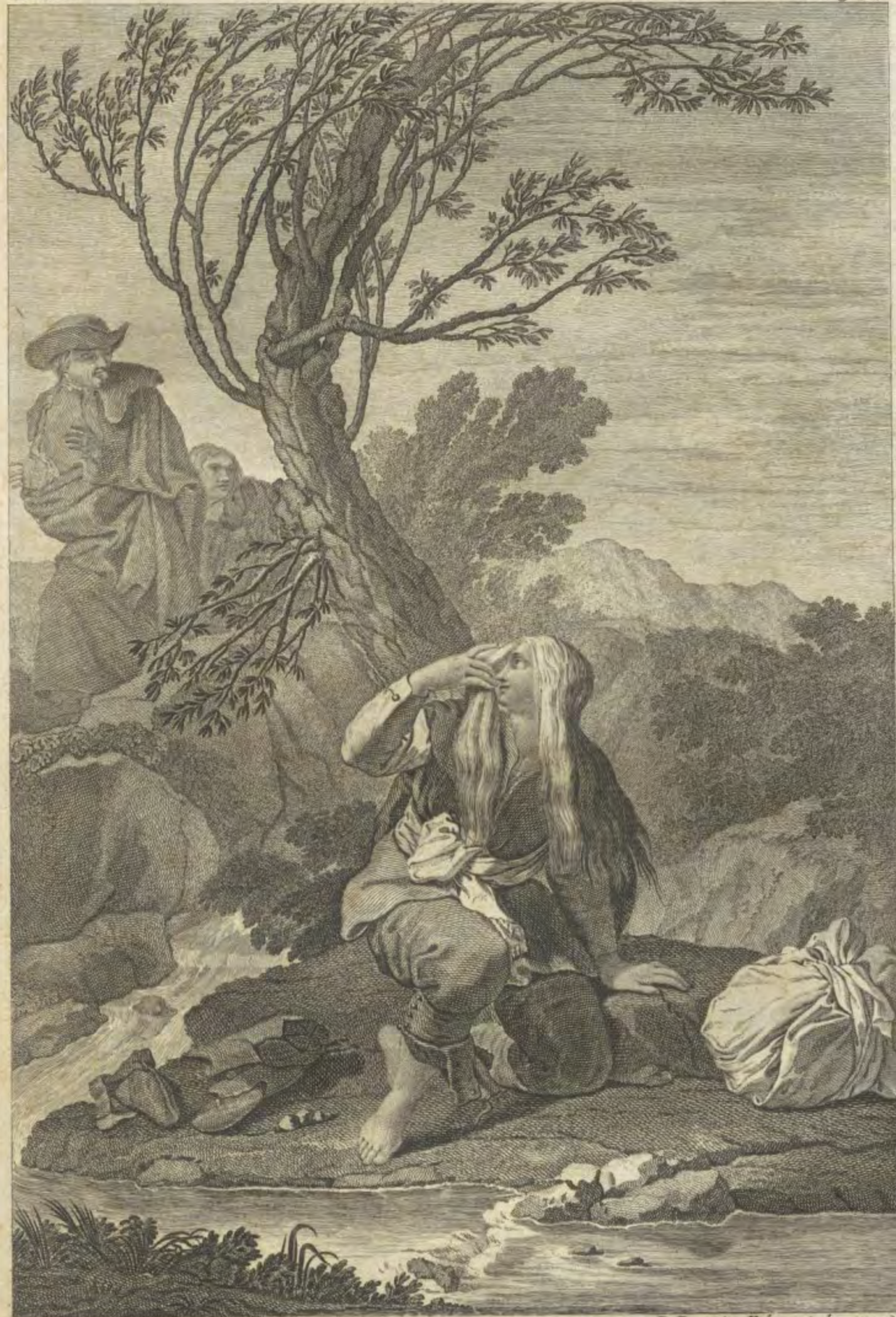
Joseph Castillo la inv. y dibujo.