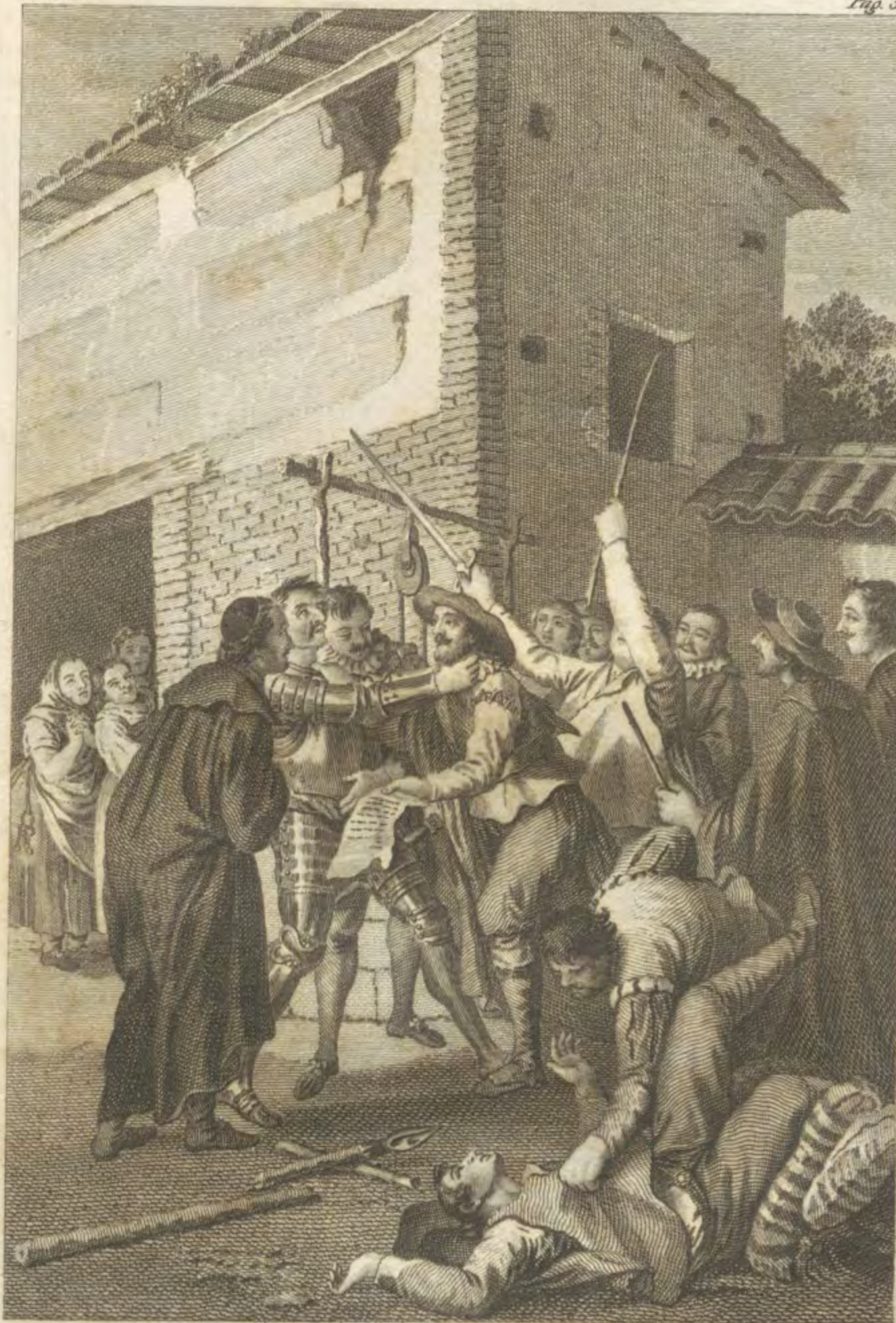
Antonio Carnicero la inv. y dibujó.