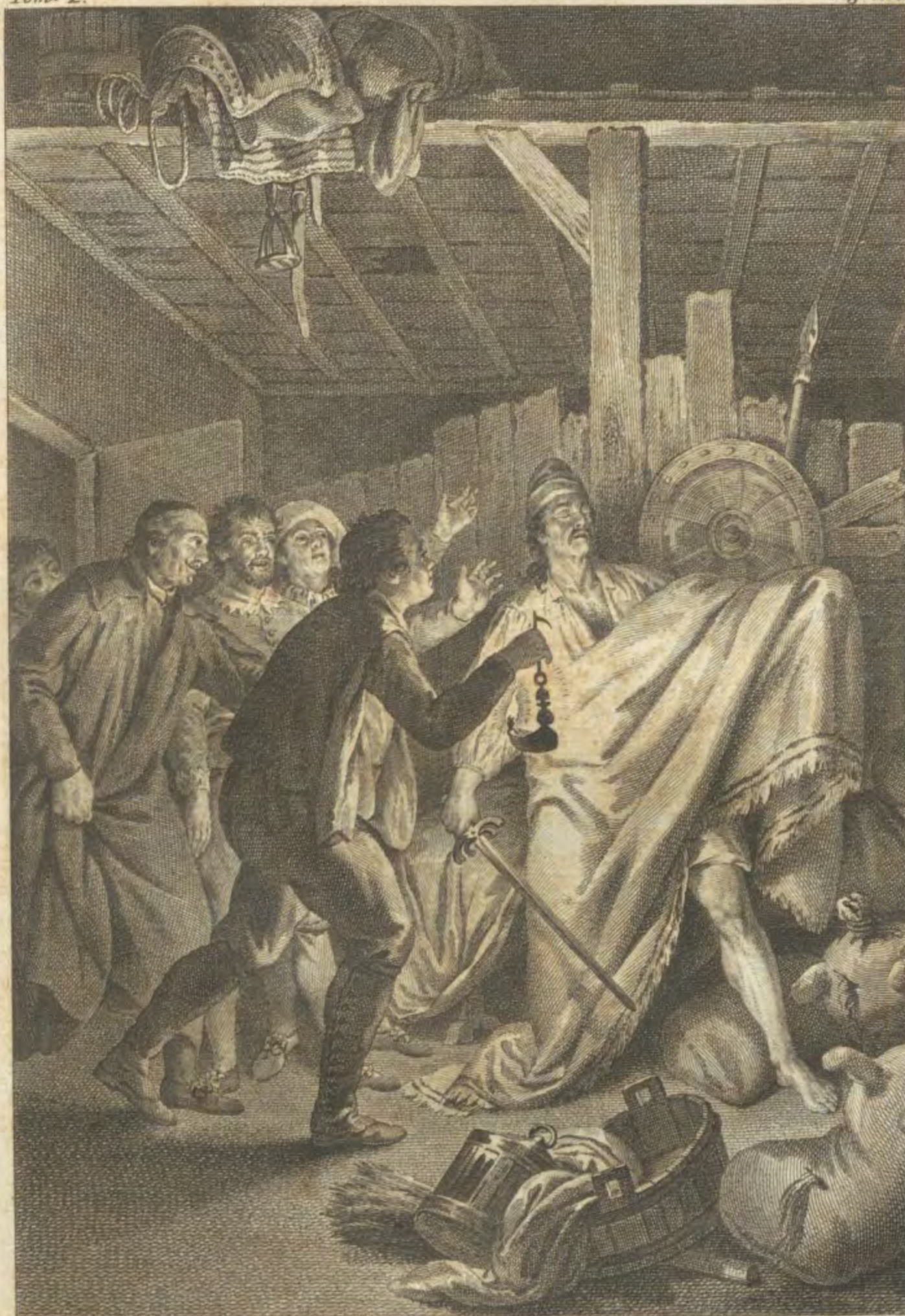
Antonio Carniero la inv. y dibujó.