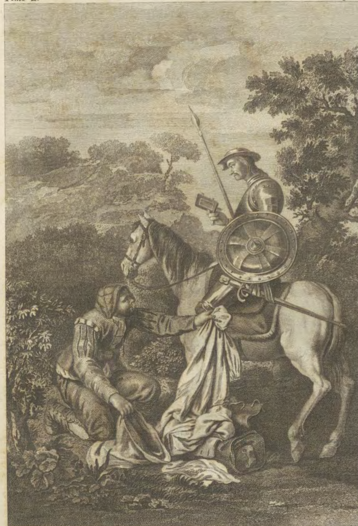
Antonio Carnicero la. inc. y dibujó.