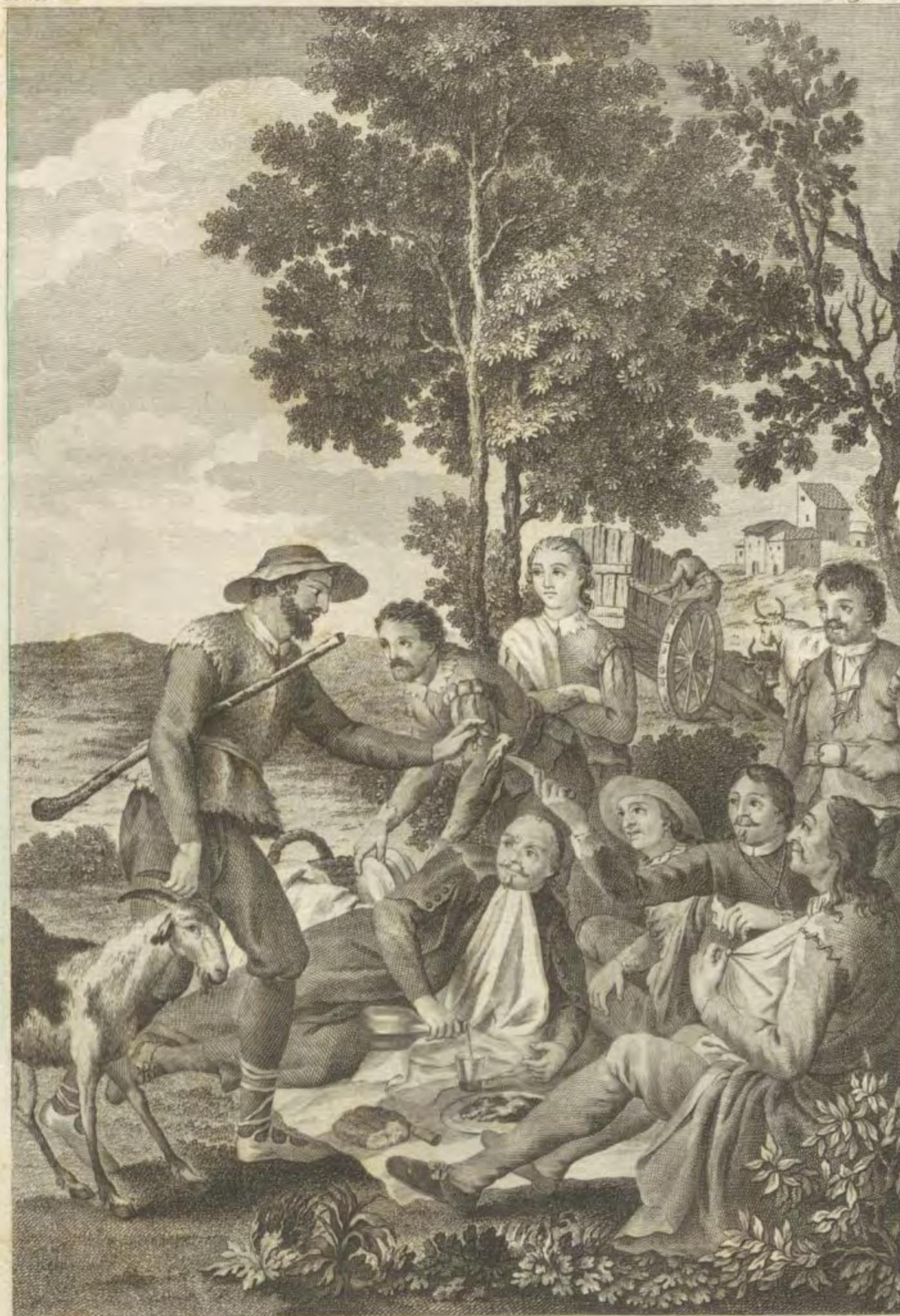
Antonio Carnicero la inventó y dibujó.