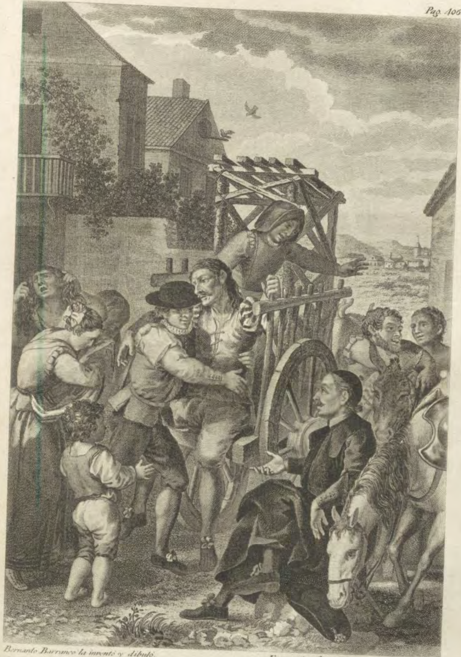
Bernardo Barranco la inventó y dibujó.