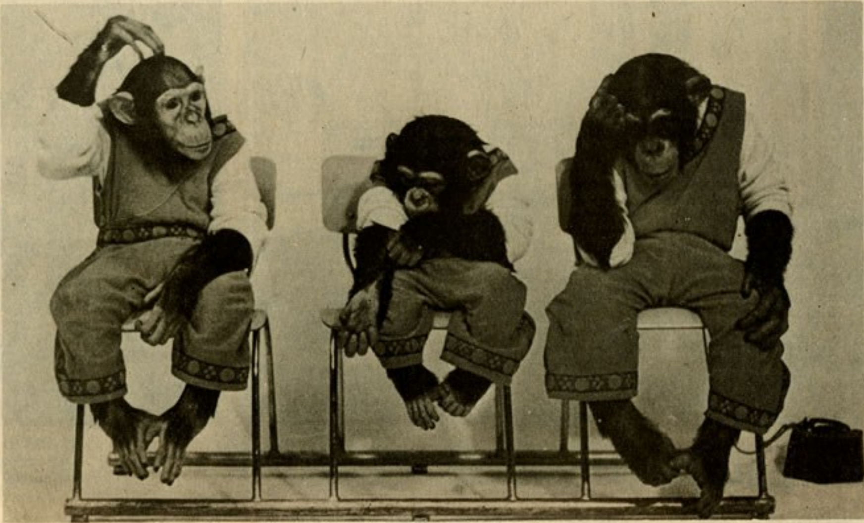
(Fotografía de Jaimar de "Tre Simpatiche Schmielte". Edizioni Quadrifoglio. Milano, Italia).