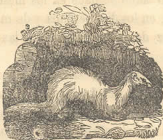
De la caza con huron.

El huron es naturalmente enemigo mortal del conejo, al que ataca con furor en cuanto le vé, y cogiéndole por el pescuezo ó por la nariz, le chupa la sangre: tiene los movimientos muy flexibles y al mismo tiempo es tan vigoroso, que vence con facilidad á un conejo que es mucho mas grande que él.