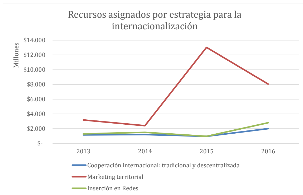
Gráfico 4 Recursos asignados por estrategia para la internacionalización