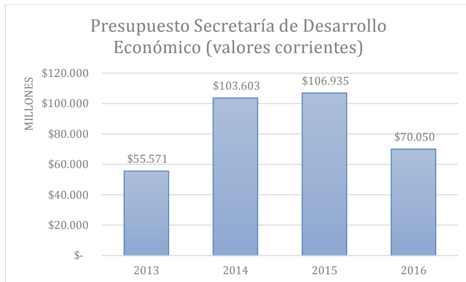
Gráfico 3 Presupuesto Secretaría de Desarrollo Económico (valores corrientes)