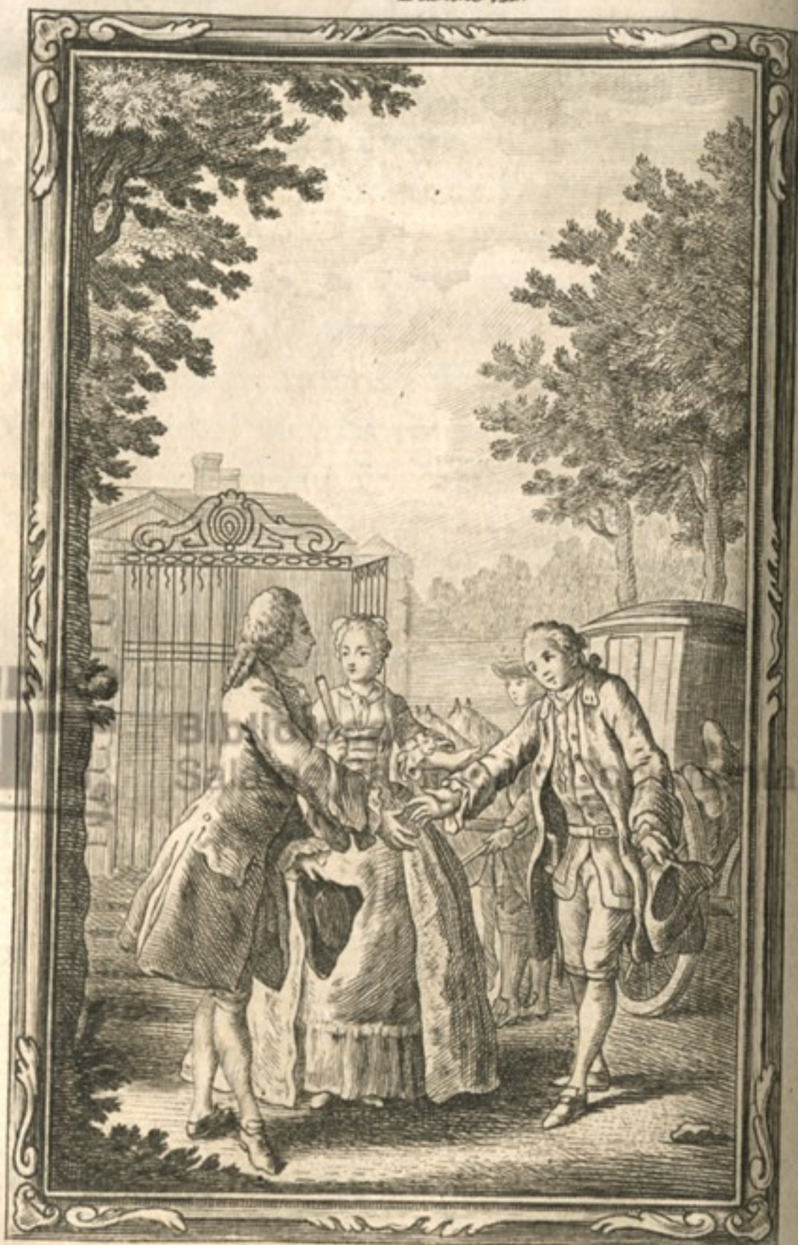
La confiance des belles ames