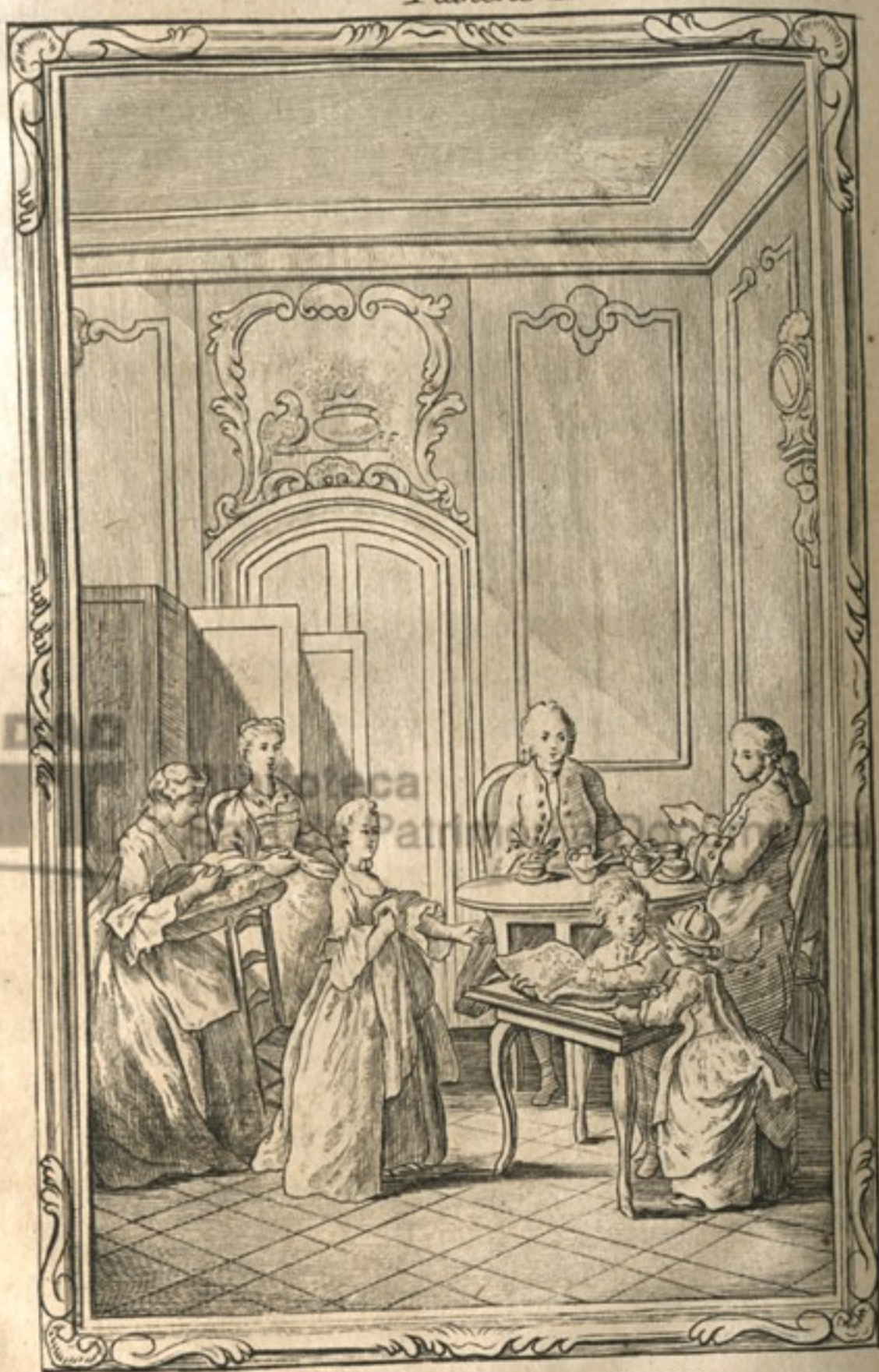
La matinée à l'Angloise.