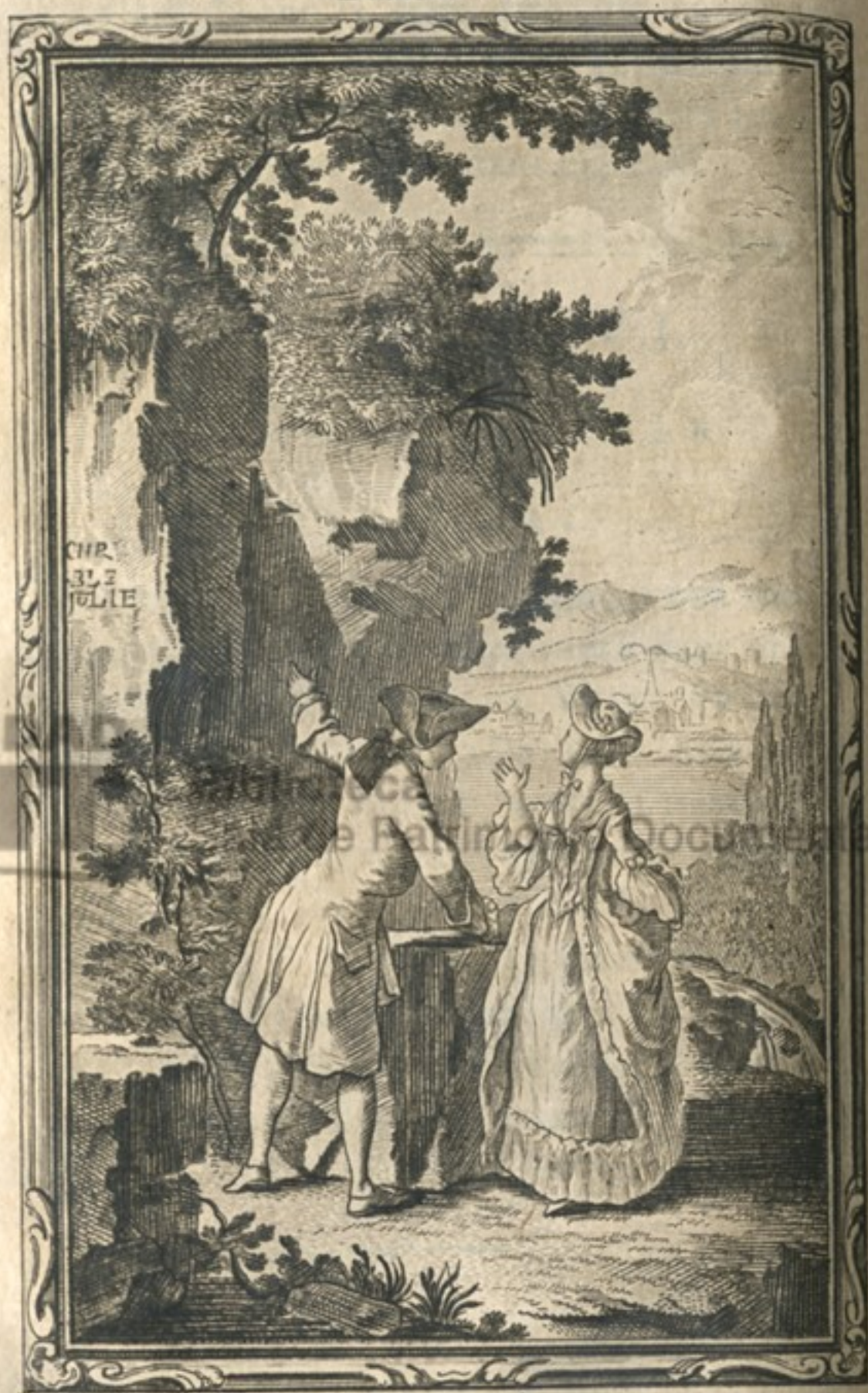
Les monumens des anciennes amours.