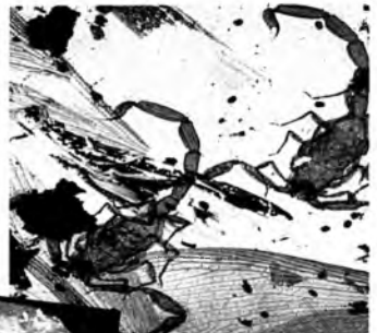
Ámbar con escorpión.

Y en el proceso de gestación de las gemas, mil y un detalles. La perla se forma cuando una clase de ostra, en defensa propia, envuelve repetitivamente, en una especie de baba, una arena invasora de su espacio. El ámbar, resina de pino cristalizada, se remonta a la época de los dinosaurios y ha sido importante para estudiar la evolución de los seres vivos, gracias a los animales que quedan, en su estructura, atrapa-