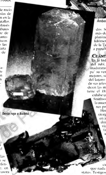
Berilo rojo o burbita.

Y no hay que olvidar el agregado sentimental, las concepciones culturales y ese argumento que nada tiene que ver con el comercio y el status. Testigos del Tercer Milenio (también escudriñan como lo hicieron los antiguos por intuición) la esencia, la energía que de esos elementos de la naturaleza emana. Los contemplan como antenas del cosmos, no como seres "animados" y puramente ornamentales.