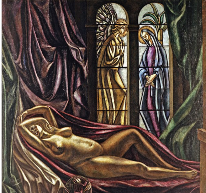
Correa, Carlos. (1941), Desnudo .

embargo, se presentó nuevamente con un nombre distinto “Desnudo”. A pesar de ser rechazada por el jurado de admisión, y gracias a una argucia de los jurados de premiación, fue colgada y además premiada.