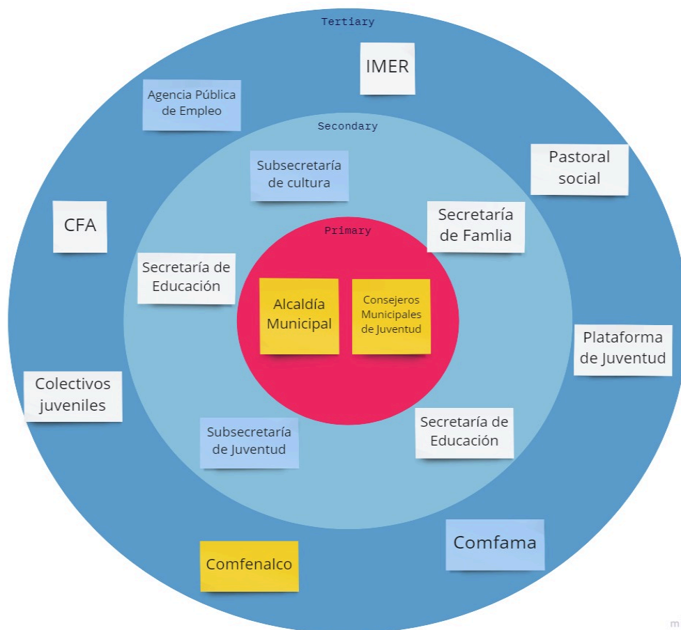
Gráfica 2. Actores involucrados en la implementación de la Política Pública de Juventud, Rionegro.