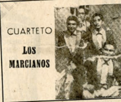
CUARTETO LOS MARCIANOS