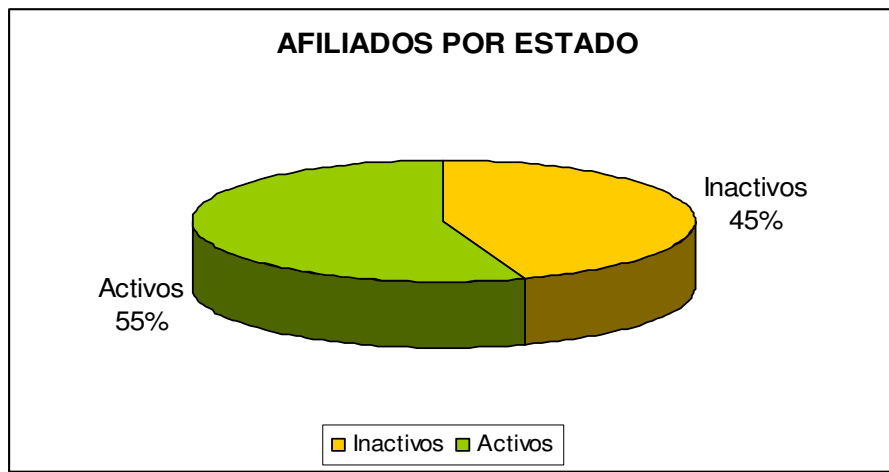
GRÁFICA No1 AFILIADOS POR ESTADO A JUNIO DE 2008

Al panorama social de desempleo, inestabilidad laboral e informalidad, se suman la poca credibilidad en el Sistema y la baja capacidad de ahorro de los colombianos, condiciones que atentan contra la cobertura del mismo.