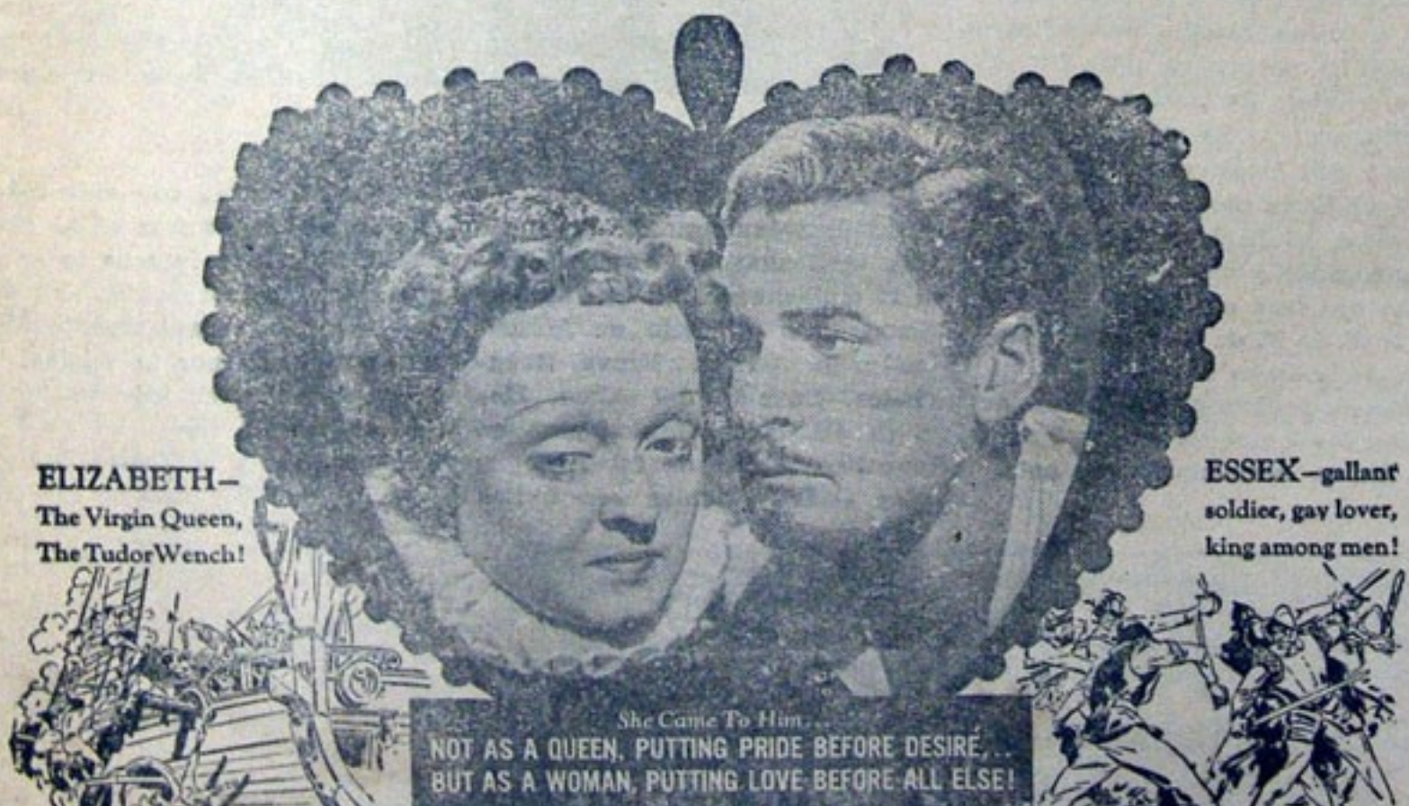
ELIZABETH— The Virgin Queen, The TudorWench!

Los policías quieren que los cantores se manden instalar "en alguna parte" un control de volumen; porque dizque ya está prohibido que den sus serenatas a pleno pulmón... mundo