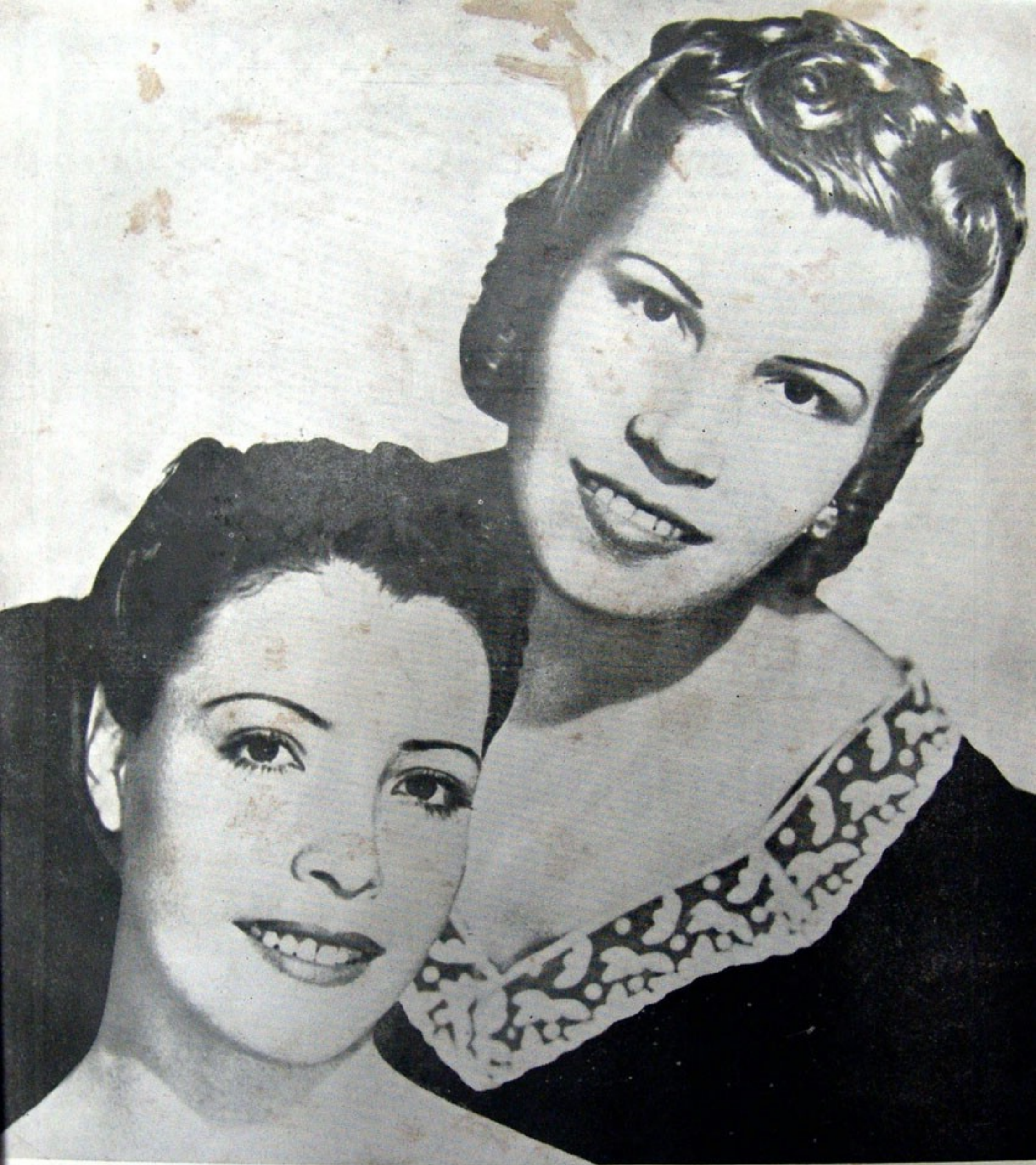
"el dúo de las voces maravillosas": HERMANAS AGUILA (artistas exclusivas KRESTO)