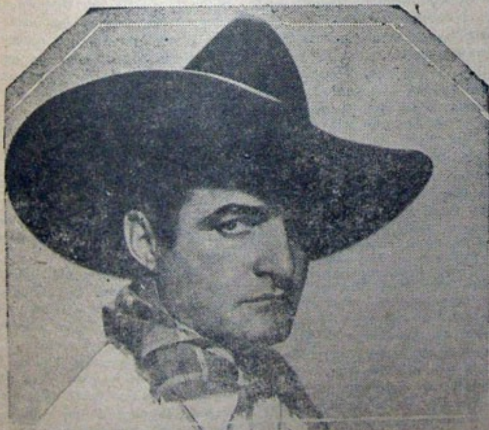
TOM MIX en "FLAMING GUNS" UNIVERSAL PICTURE

Alguno tuvo que decirle a Gracie Fields que es graciosa. Flaco servicio el que le hizo ese adu-