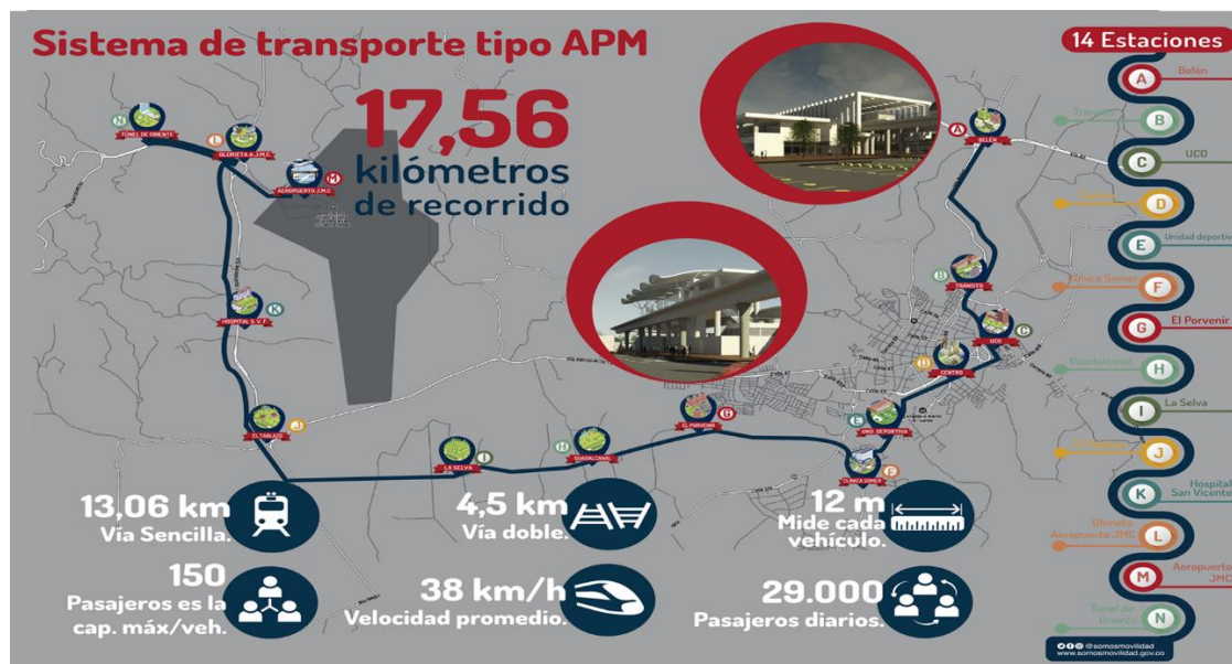
Ilustración 1. Trazado del Sistema de Transporte APM

De esta manera, FONADE estructuró un proyecto que consiste en la construcción de un movilizador automático de personas (APM por sus siglas en inglés), una terminal de transporte central y terminales satélites de transferencia de pasajeros. El trazado del sistema de transporte tipo APM tendrá una extensión de 17,56 kilómetros, 14 estaciones (una estación central, tres estaciones de transferencia, ocho estaciones tipo uno, una estación tipo dos y una estación tipo tres) y su operación será llevada a cabo por 28 vehículos (Alcaldía de Rionegro, 2018). El trazado del tren y la ubicación de las estaciones de transferencia de pasajeros se ilustran en la siguiente imagen: