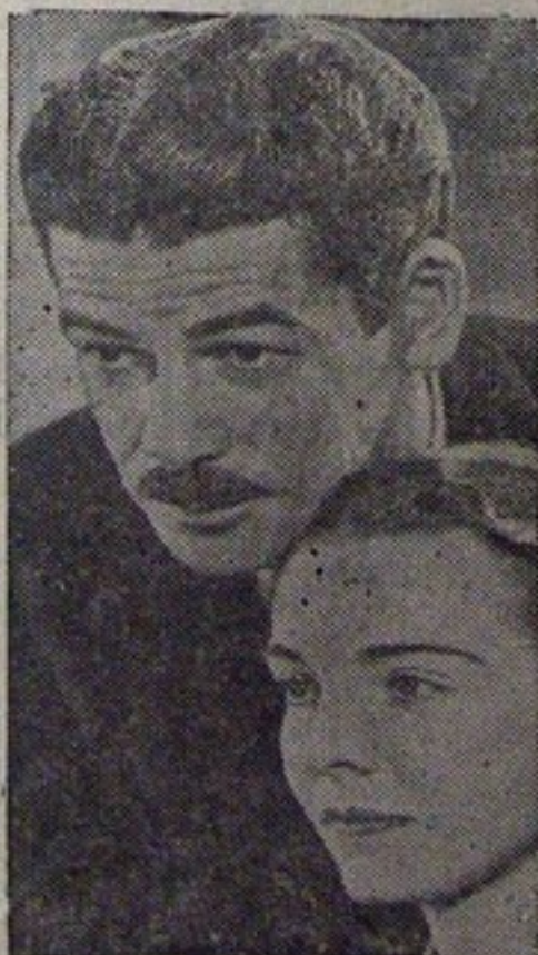
PAUL MUNI y JANE BRYAN, en la gran super-producción NO ESTAMOS SOLOS. Destinada para el primer jueves de noviembre en el JUNÍN.