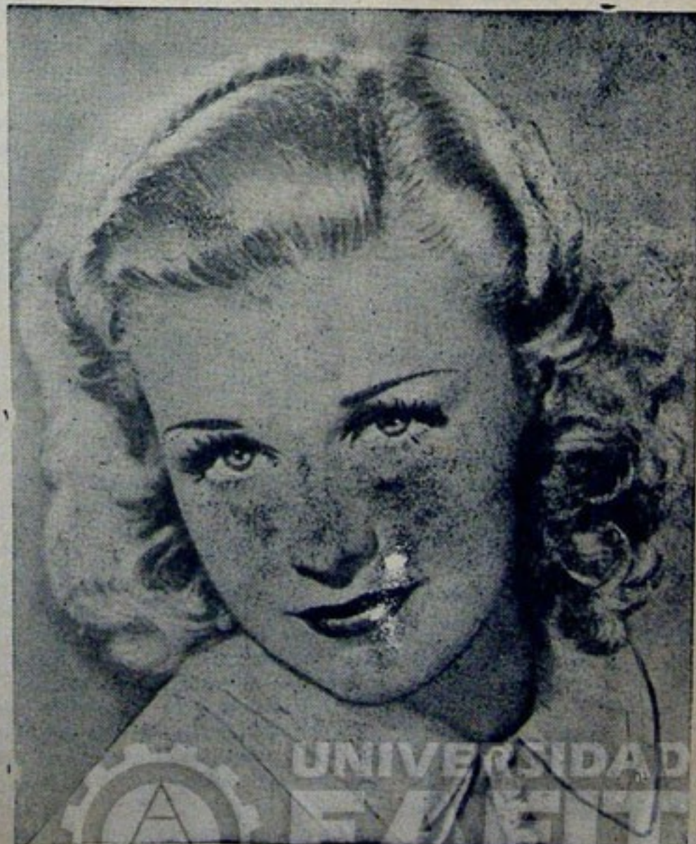
GINGER ROGERS, ofrece la mejor interpretación de su carrera artística en "MAMA SOLTERA", otro de los grandes estrenos del JUNIN para noviembre.

La más amena transmisión para empezar la semana!