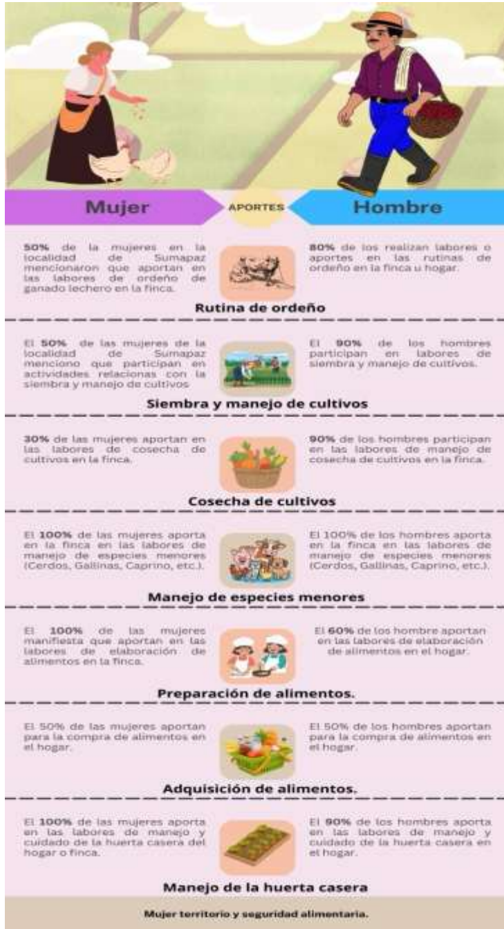
4 Figura: Roles entre Mujeres y Hombres en la Seguridad Alimentaria