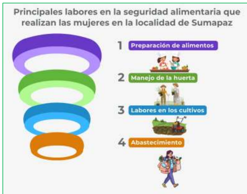
2 Figura. Principales labores en la seguridad alimentaria que se realizan en el territorio de Sumapaz.

La gráfica permite visualizar que la mayor contribución de la mujer rural a la seguridad alimentaria está enmarcada en la etapa de preparación de los alimentos y manejo de la huerta como indicador de su responsabilidad directa sobre el consumo y por ende la sostenibilidad de los sistemas