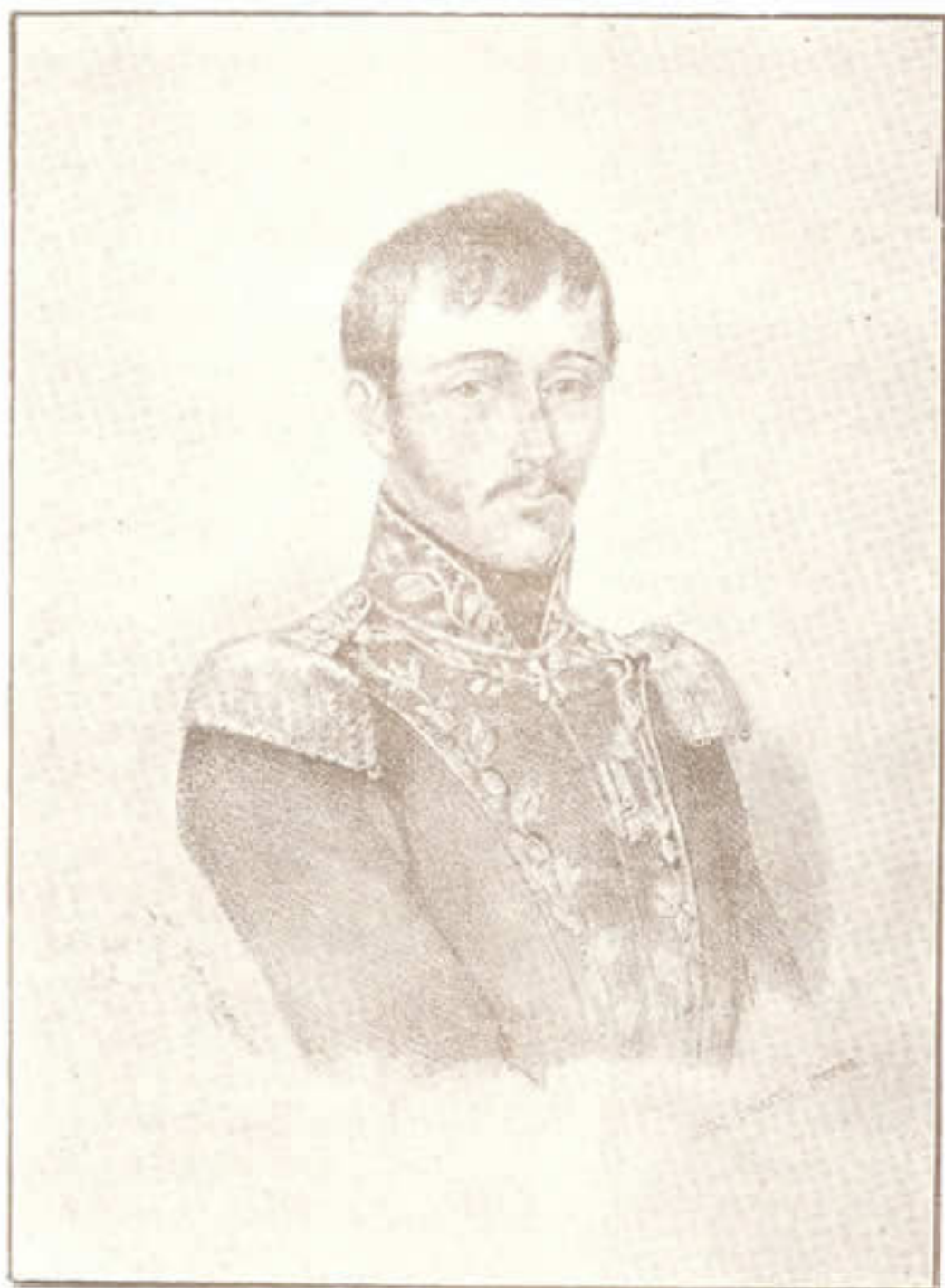
General JOSE ANTONIO ANZOATEGUI Comandante de la División de Retaguardia