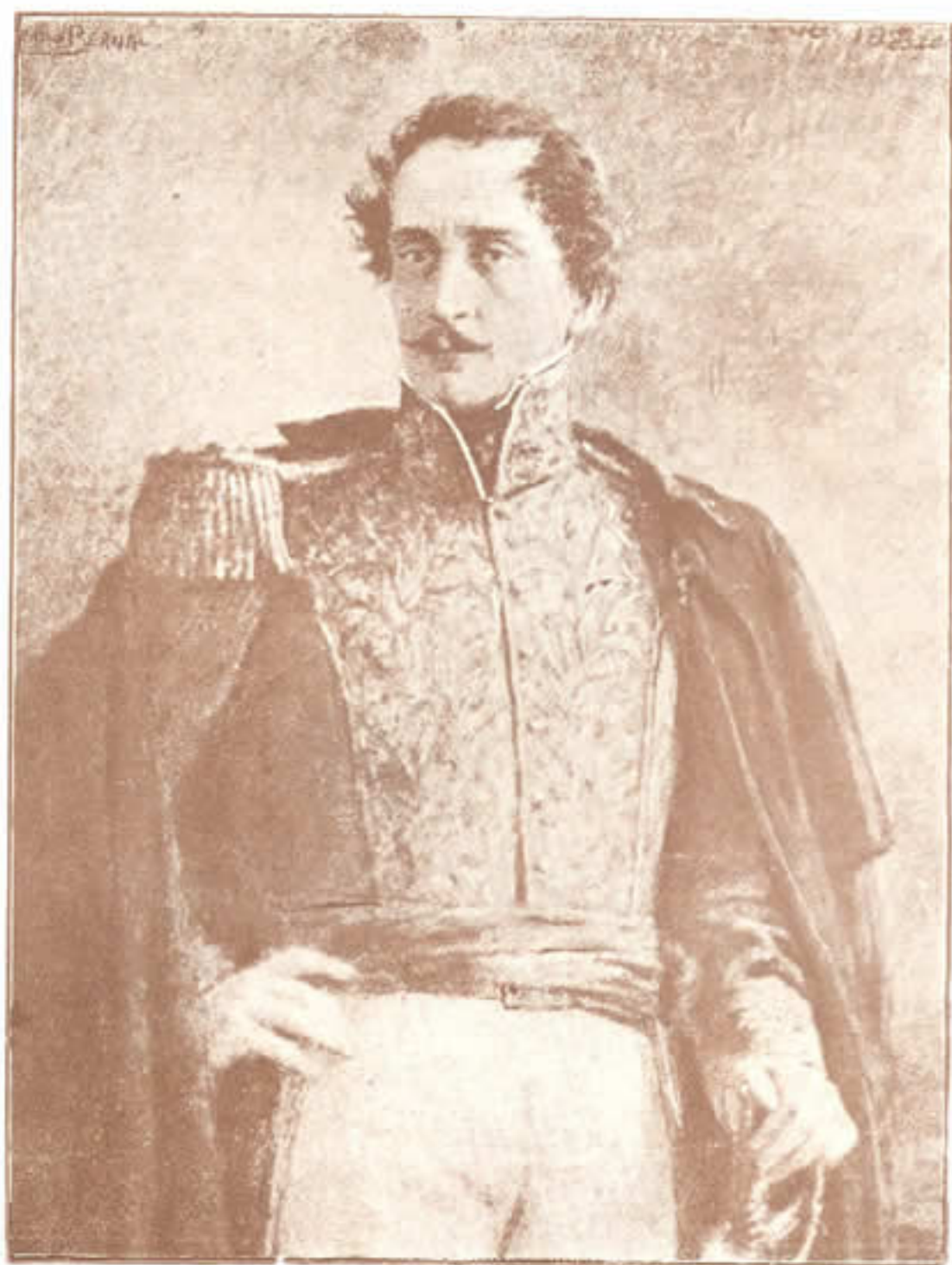
General FRANCISCO DE PAULA SANTANDER Comandante de la División de Vanguardia