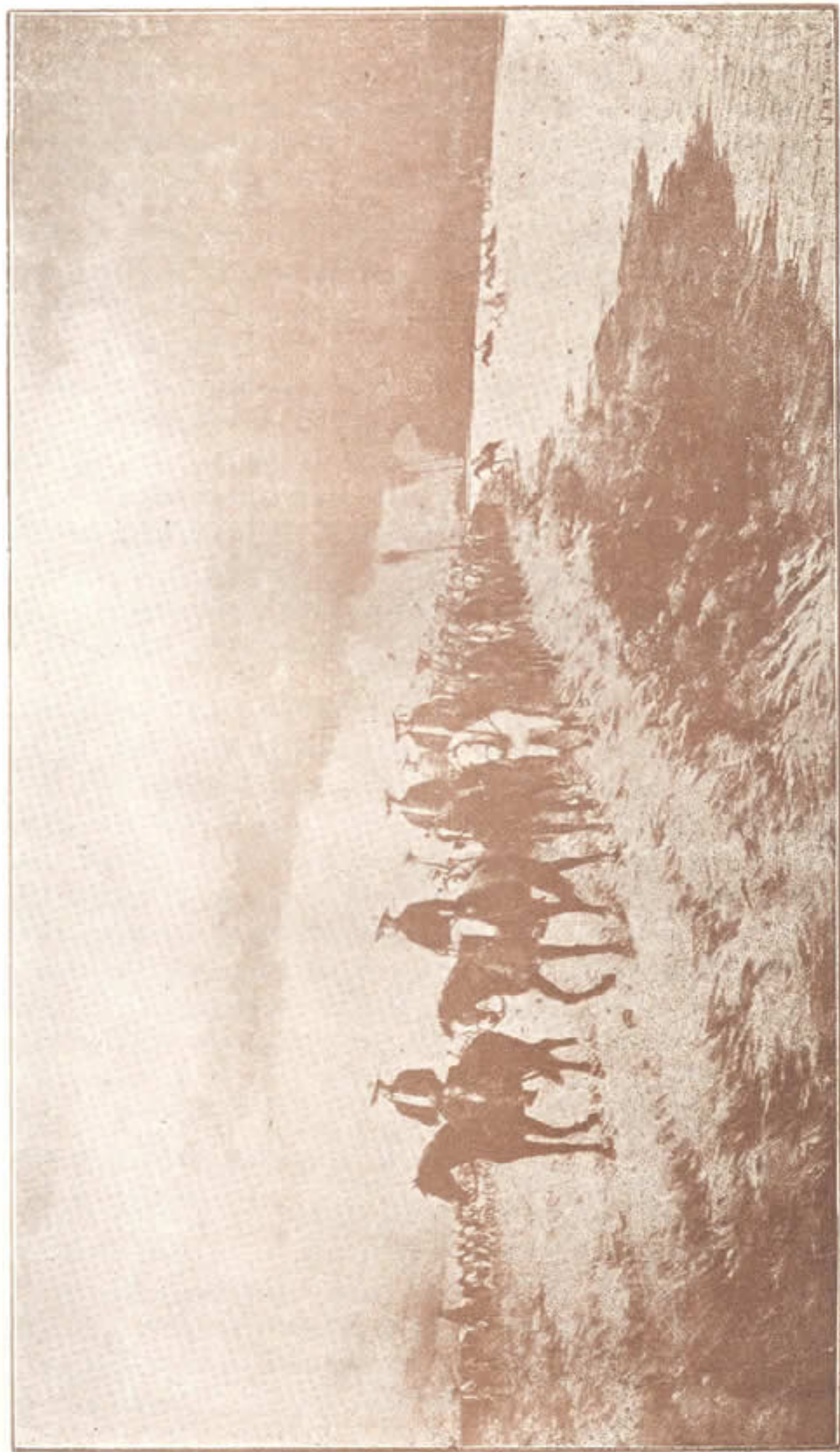
Paso del Ejército Libertador por los Llanos de Casanare