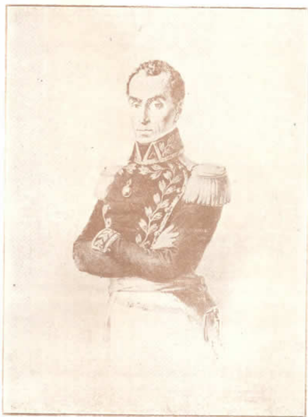
Libertador SIMON BOLIVAR