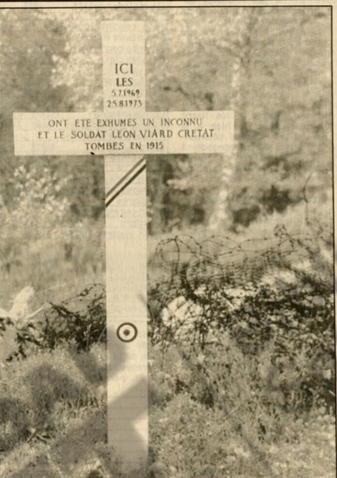
Trincheras. Y la tumba de "un desconocido y del soldado León Viard Cretat", caídos en 1915.