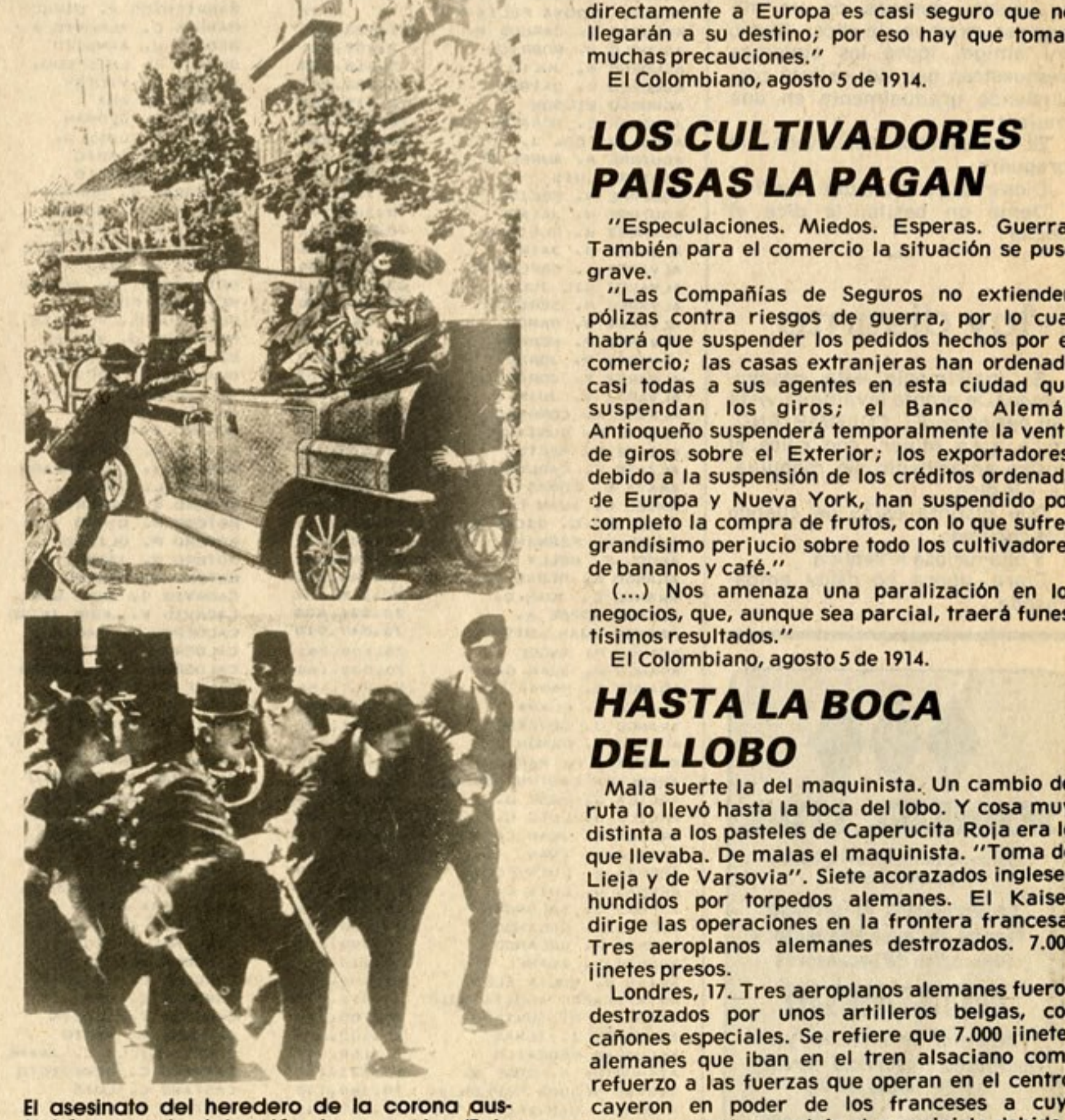
El asesinato del heredero de la corona austrohúngara y la detención de su asesino (Foto de Jaimar, del libro Crónicas del Siglo XX -Editorial Plaza & Janés-).

"Mala suerte la del maquinista. Un cambio de ruta lo llevó hasta la boca del lobo. Y cosa muy distinta a los pasteles de Capuchita Roja era lo que llevaba. De malas el maquinista. "Toma de Lieja y de Varsovia". Siete acorazados ingleses hundidos por torpedos alemanes. El Kaiser dirige las operaciones en la frontera francesa. Tres aeroplanos alemanes destruidos. 7.000 ínetes presos. Londres, 17. Tres aeroplanos alemanes fueron destruidos por unos artilleros belgas, con cañones especiales. Se refiere que 7.000 ínetes alemanes que iban en el tren alsaciano como refuerzo a las fuerzas que operan en el centro, cayeron en poder de los franceses a cuyo campamento los condujo el maquinista debido a un mal cambio de vía en la línea férrea." El Colombiano, agosto 18 de 1914.