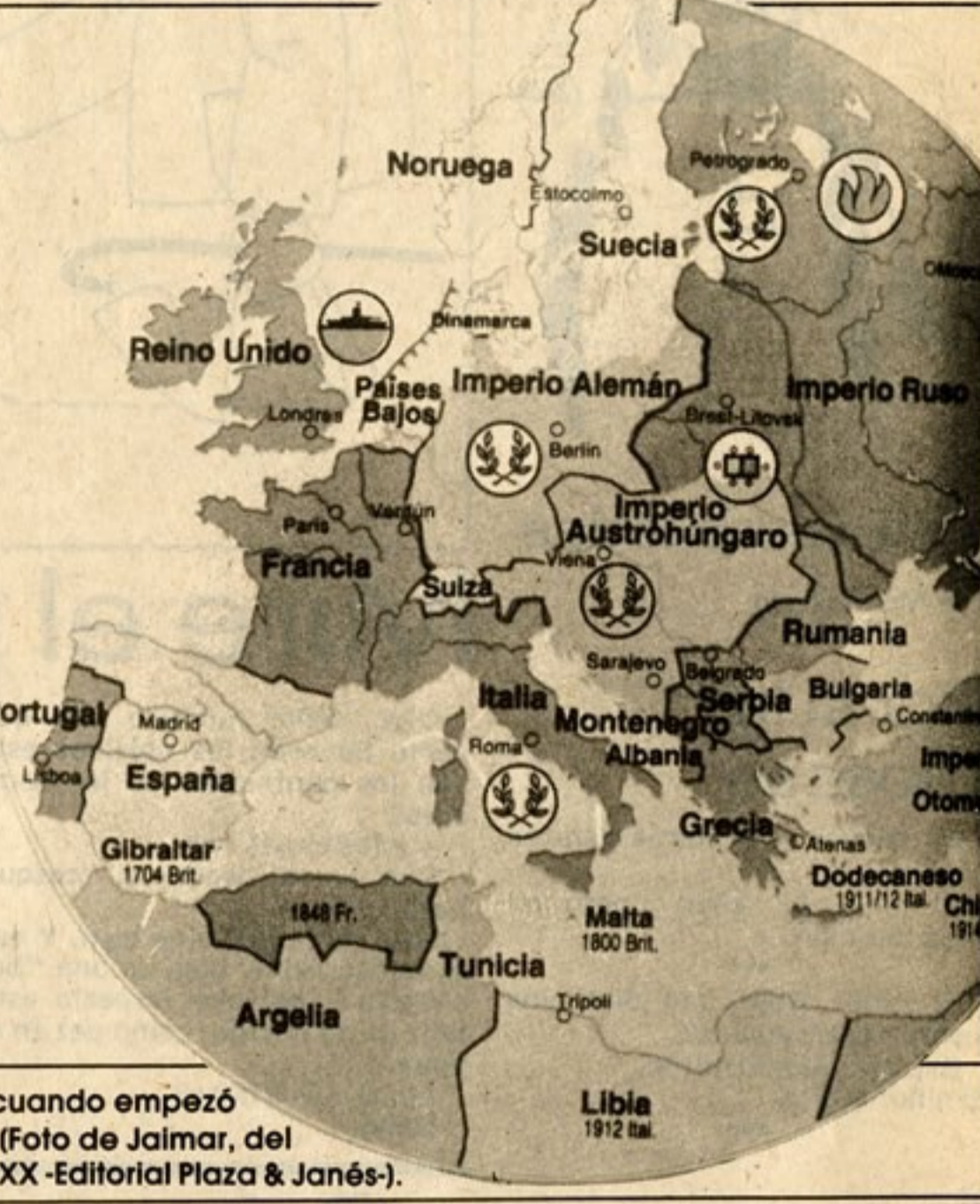
Así estaba Europa, cuando empezó la I Guerra (Foto de Jaimar, del libro Crónicas del Siglo XX -Editorial Plaza & Janés-).

Yo te apoyo. Tú me apoyas. Te quito y te doy. Ni contigo, ni sin ti. Aquí entre nos... ¡Vamos a la guerra! STOP... Y la guerra va para largo.