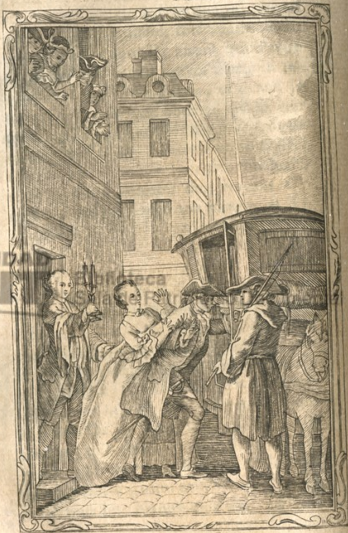
La honte et les remords vengent l'amour outragé