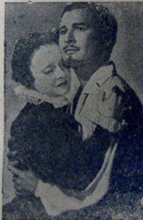
BETTE DAVIS y ERROL FLYN en "Mi Reino por un Amor" octubre en el Junín.

Cuándo será que nuestros locutores adoptan la costumbre de anunciar el nombre del autor, compositor y cantor? Ningún trabajo parece que diera tal cosa y sin embargo no lo hacen; o lo hacen erradamente adrede; a muchos les hemos escuchado cuando dicen: "seguidamente una canción de Pedro Vargas titulada FRACASO"; un enorme disparate que es perjudicial; esa canción no es de Pedro Vargas sino de un señor llamado Esparza Oteo (o algo así); los escuchas quieren saber quiénes hacen las canciones; los cantantes bien se conocen por la voz, sin necesidad (en la mayoría de los casos) de que se les anuncie Y si los escuchas no desean tal de talle, tampoco hay razón para que un compositor quede ignorado a causa de la desidia de los speakers.