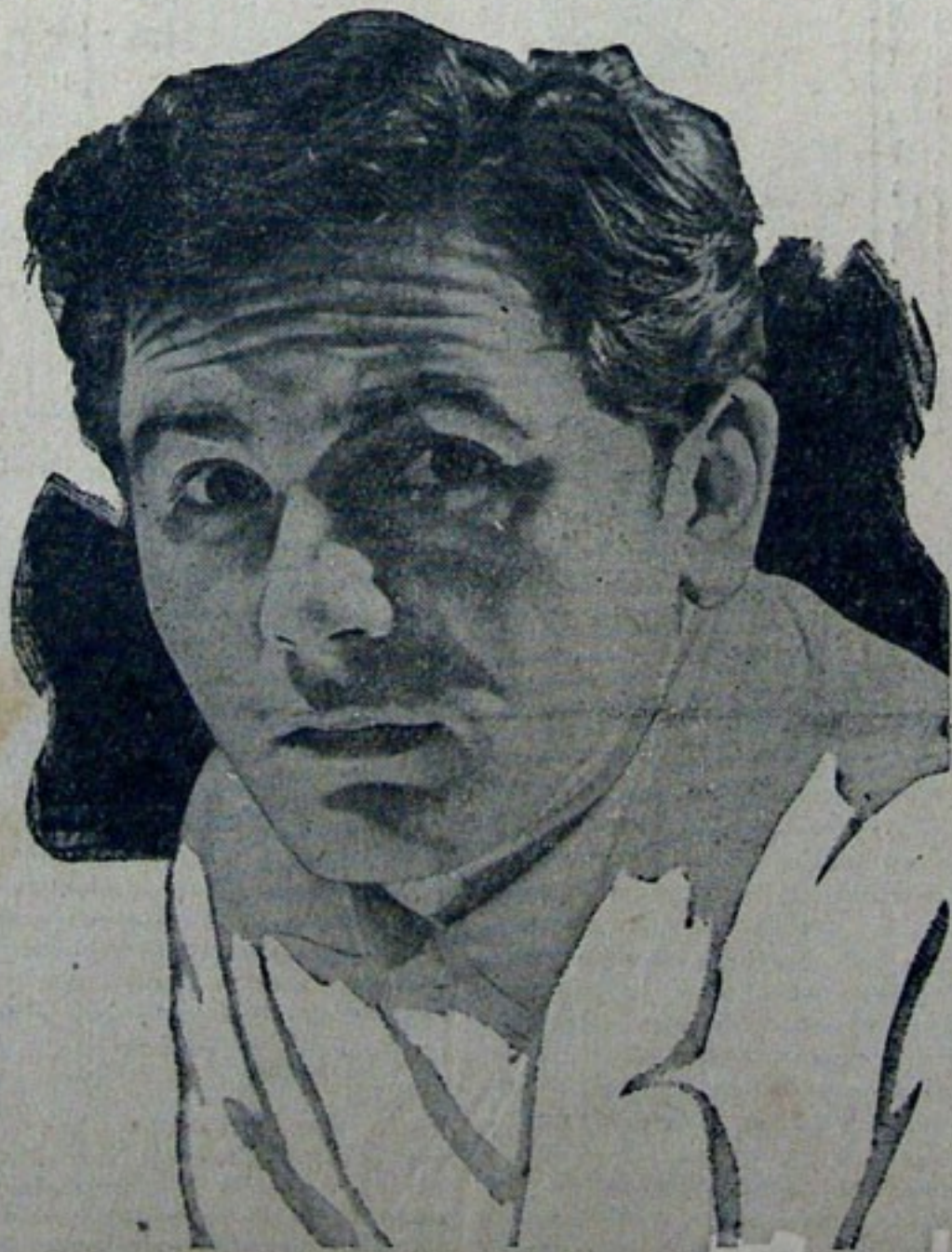
John Garfield. Para octubre en el Junin: "Cruel es mi destino".