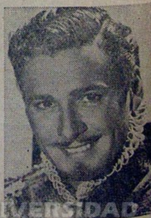
ERROL FLYNN en la gran superproducción filmada íntegramente en technicolor: "MI REINO POR UN AMOR", joya de Warner Bros cuyo estreno se anuncia para el último jueves de octubre en el