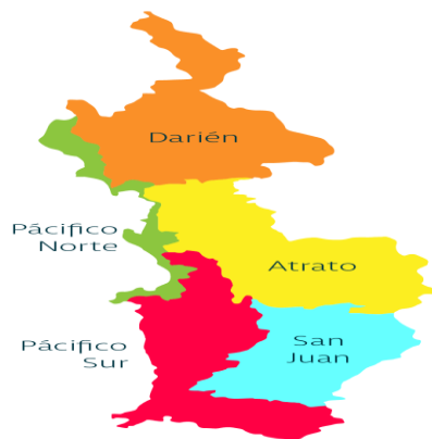
Ilustración 1. Mapa del departamento del Chocó y sus regiones