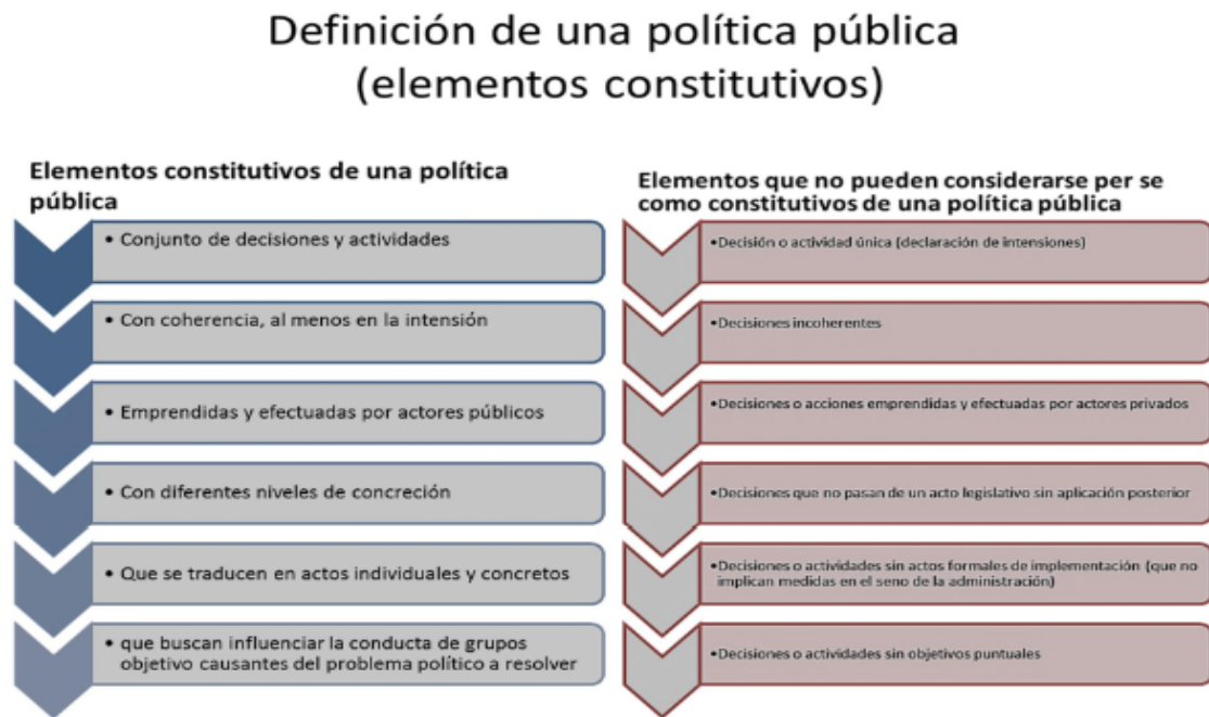
Ilustración 4. Definición de una política pública (elementos sustitutos)

Fuente: Elementos Constitutivos de una Política Pública. Subirat (2018).