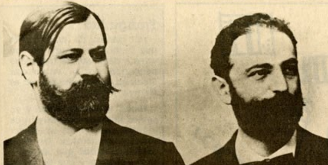
Una amistad neurótica, dependiente. La de Freud con Wilhelm Fleiss (Del libro Freud - el hombre, su mundo, su influencia - dirigido por Jonathan Miller).