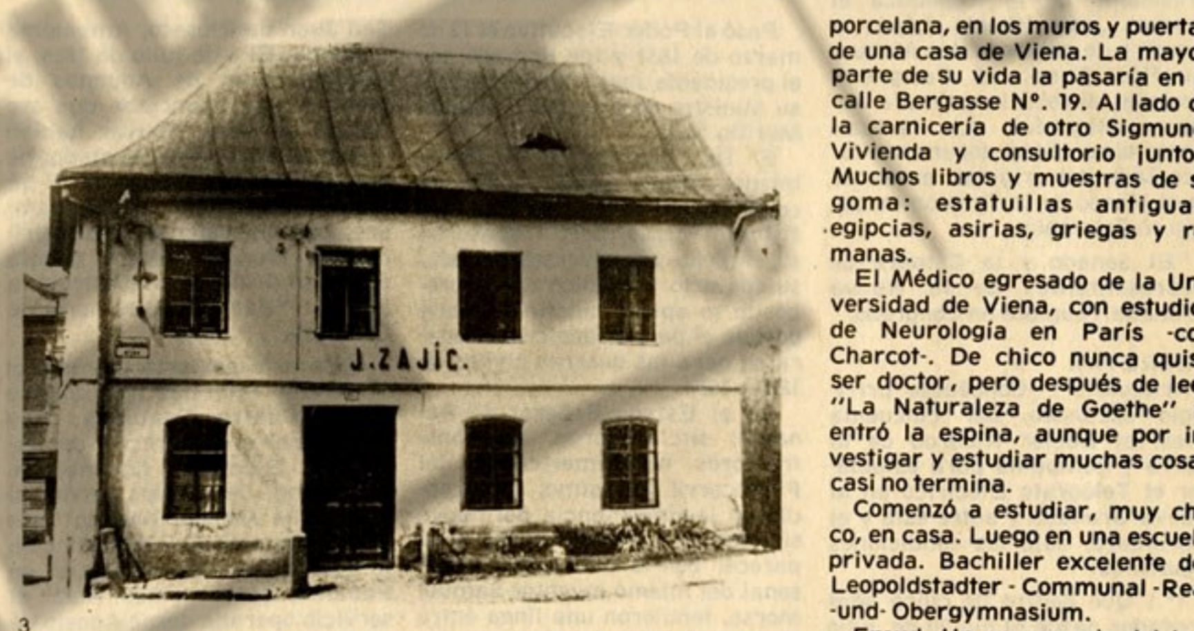
La casa de Freud en Friburgo, un tranquilo pueblo del imperio austro-húngaro. Hoy, Pribor, Checoslovaquia.