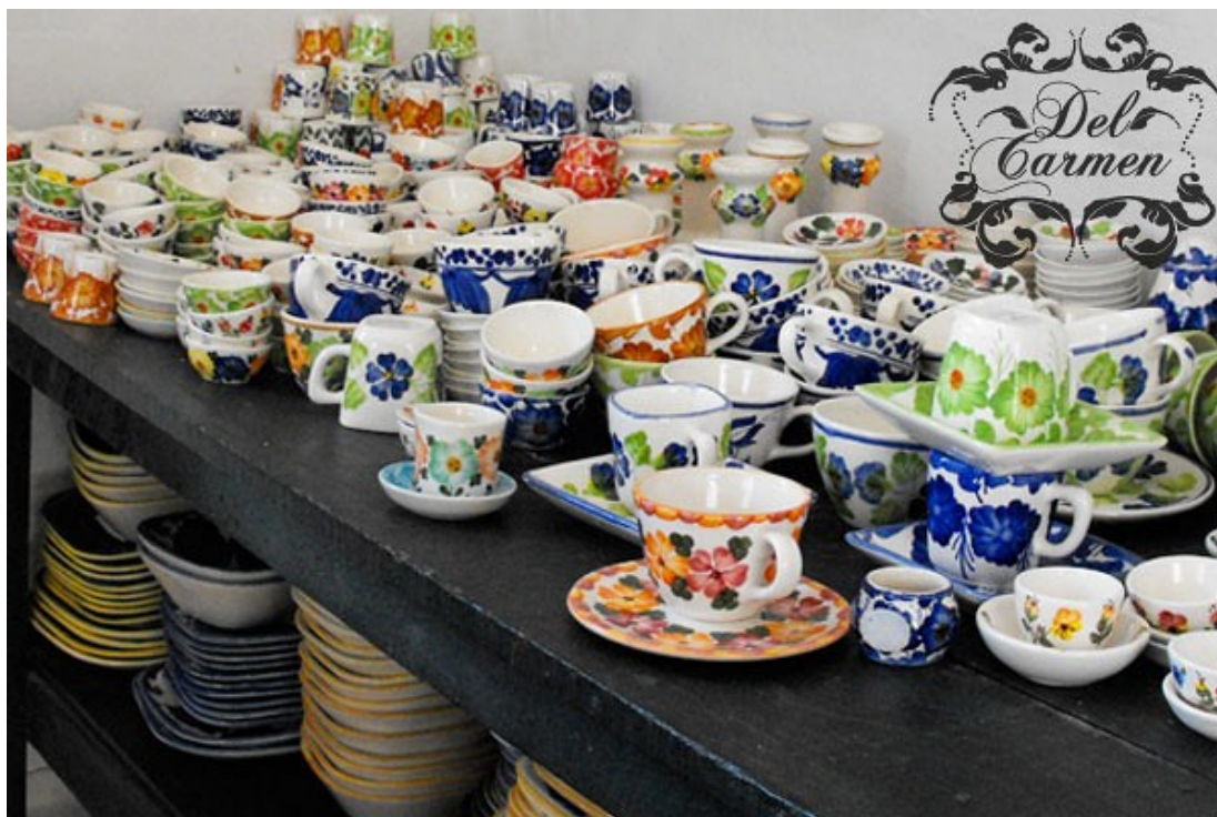
Del Carmen Galería, Tomado de: https://bit.ly/3v6H0Dj Diseños decorativos de la cerámica que se fabrica en el municipio.

El desarrollo de la cerámica en El Carmen de Viboral llevó a que Ramón Antonio y Manuel Betancur un par de insignes lugareños fundaran la Escuela Nacional de Cerámica Jorge Eliécer Gaitán en 1945. Esta escuela dio paso a la formación del actual Instituto Técnico Industrial, que cuenta con talleres de cerámica y hornos para que los jóvenes carmelitanos se formen en el oficio.