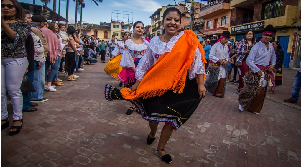
Carnavalito de música andina y latinoamericana.

En complemento a las anteriores festividades, se ha trabajado en el afianzamiento del Foro Anual de Filosofía y en el desarrollo de estrategias de sociabilidad de la práctica filosófica, que se puede concebir como una producción cultural, que hace parte de la circulación de saberes, la tradición oral y técnica, las formas artísticas y, sobre todo, el intercambio de ideas. Esta actividad ha tenido un alcance representativo y en ella se ha logrado vincular a participantes de múltiples grupos poblacionales, por otro lado, su posicionamiento ha estado alcanzando cada vez más un carácter regional.