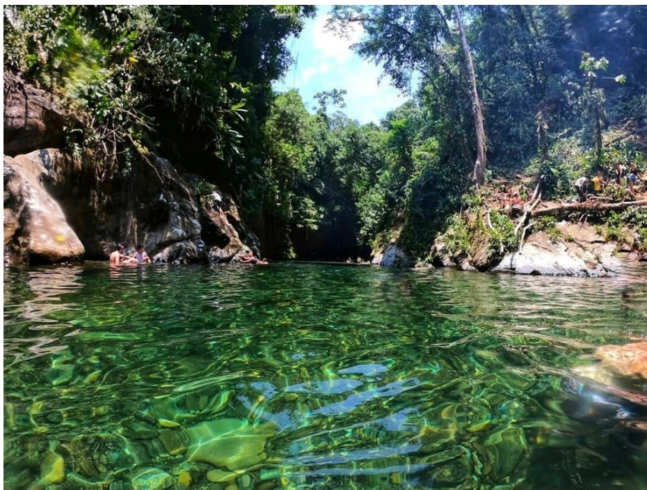
Río Melcocho.

Ya para terminar, el sistema municipal de áreas protegidas por su parte abarca una gran parte de la zona rural del municipio, incluyendo veredas ubicadas en tres microcuencas de gran importancia para la región y el país: la del Río Cocorná, las de los ríos Melcocho y Santo Domingo y la del río San Lorenzo, estos lugares son catalogados de gran valor ecológico, científico, turístico y educativo para toda la región. Allí se encuentra también una invaluable herencia campesina cuyo arraigo ha logrado perdurar y sobreponerse a las dificultades económicas, a los efectos colaterales del desarrollo tecnológico y en consecuencia la contaminación, así como al conflicto armado, del cual fueron víctimas estas comunidades. En conclusión, estas condiciones amplían la oferta ambiental municipal, y se yuxtaponen a la belleza escénica compuesta por cascadas y cobertura boscosa conservada, lo cual sigue siendo un importante atractivo turístico. (Municipio de El Carmen de Viboral, 2015. En Cornare, 2016).