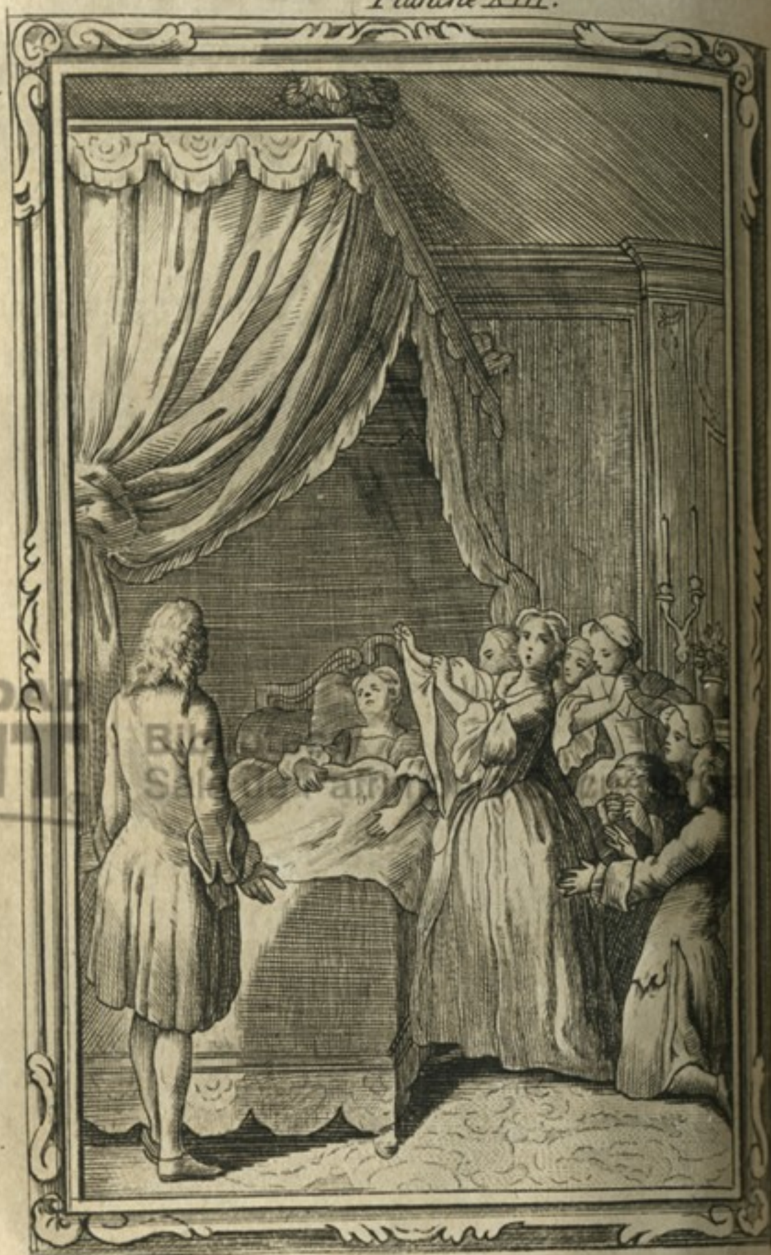
En A. grand fest