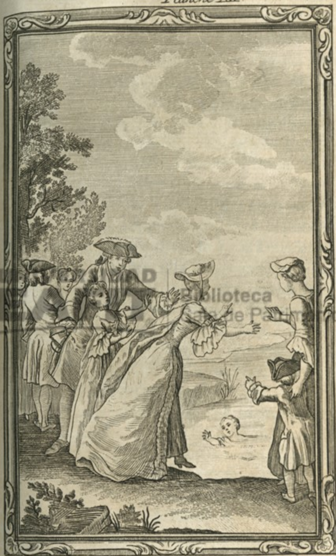
L'amour maternel .