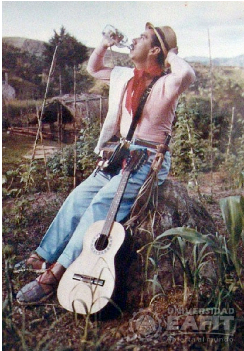
▼ León Cardona García, La Voz de Colombia