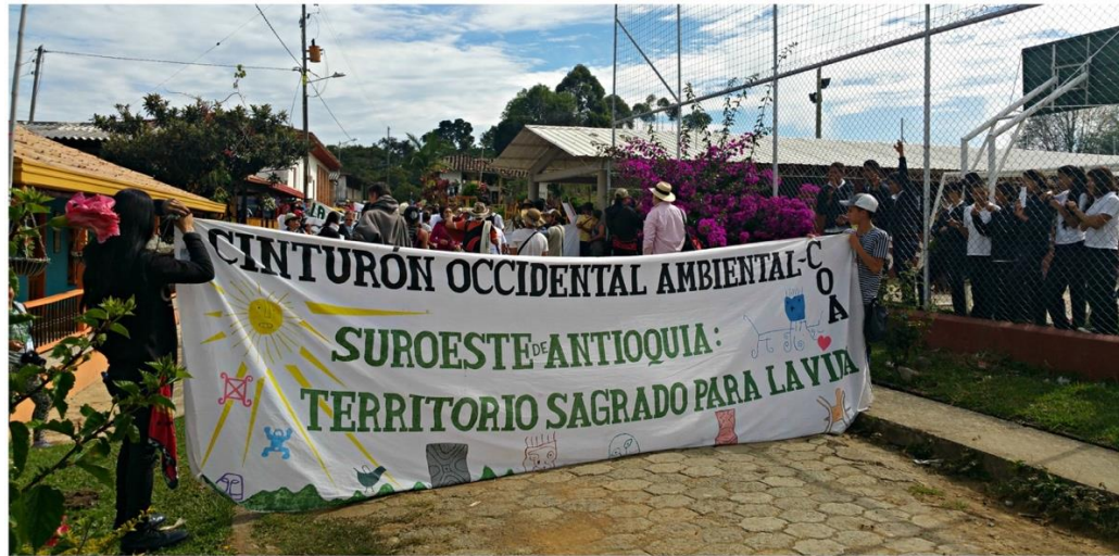
FOTOGRAFÍA 2. Recorrido durante El Abrazo a la Montaña