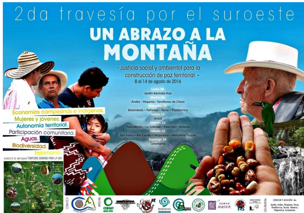
ILUSTRACIÓN 4. Invitación a la Segunda Travesía por el Suroeste: Un Abrazo a la Montaña.

En el Abrazo, los diversos actores socializan puntos de vista, reflexionan sobre el ordenamiento territorial minero y denuncian hechos sobre los usos del suelo. A partir del reconocimiento de la conflictividad socioambiental, fortalecen su articulación interna abordan diversos temas, entre los que se incluyen el papel de los jóvenes y de las mujeres en la construcción del territorio.