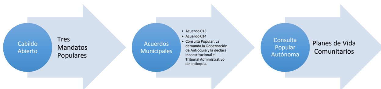
GRÁFICO 1. Proceso de la participación política en Pueblorrico

Además de estas acciones, el 2014 es un año de bastante movimiento para el COA, porque se lleva a cabo el Cuarto Consejo de Concejales en Támesis, el Primer Encuentro Regional de Economías Indígenas y Campesinas en Caramanta, charlas y foros con estudiantes de las Instituciones Educativas municipales, articulaciones con la Cumbre Agraria, Campesina, Étnica y Popular, y la continuidad del proceso de educación popular con la Escuela de Sustentabilidad en San Pablo, Pueblorrico y Farallones (Ciudad Bolívar).