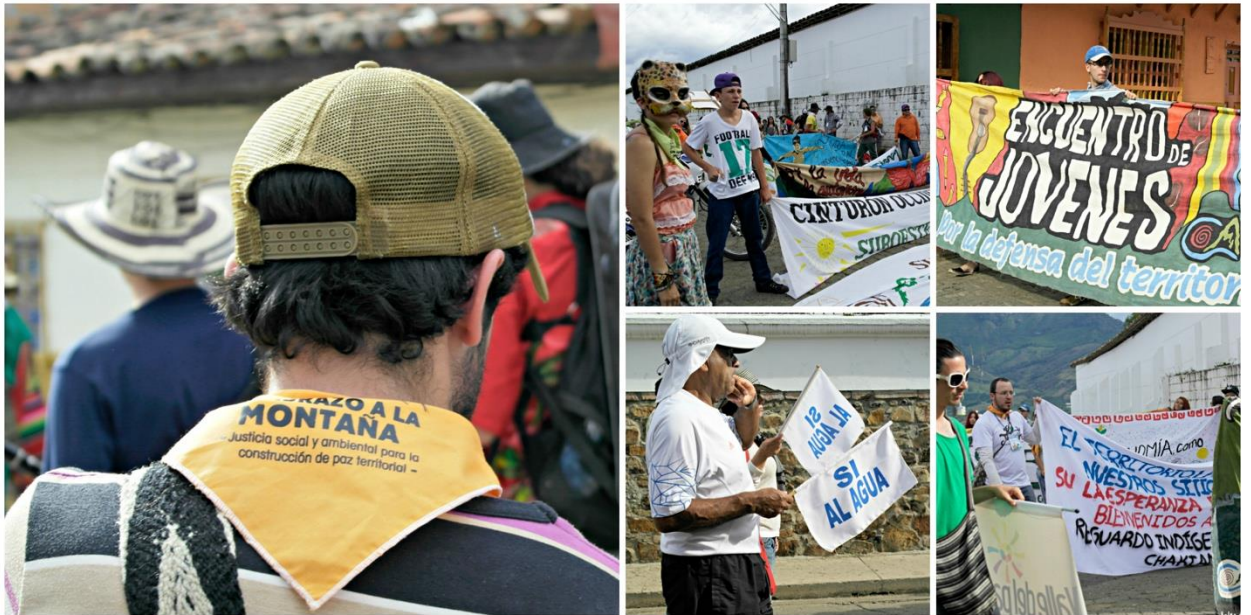
FOTOGRAFÍA 4. Fotografías tomadas durante el recorrido de la Segunda Travesía por el Suroeste: Un Abrazo a la Montaña. Serie 2.