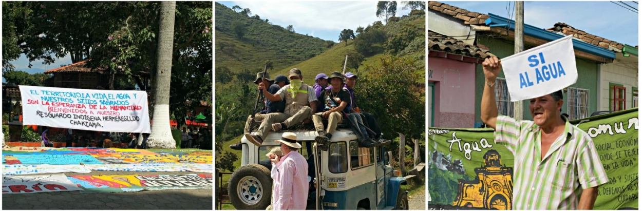
FOTOGRAFÍA 6. "Sí a la Vida, al Agua y al Territorio".