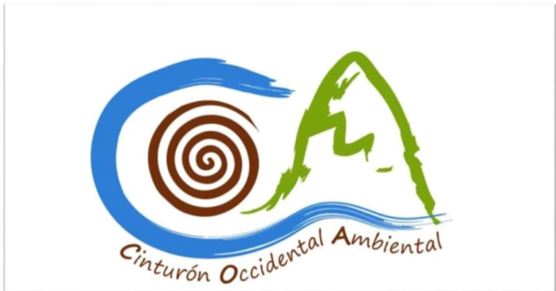
ILUSTRACIÓN 3. Imagen representativa del Cinturón Occidental Ambiental

Las primeras acciones que emprende el COA son: los Foros sobre el Agua en el corregimiento Tapartó en Andes, el I Foro Social Minero en Jericó, y el II Foro Social Minero en San Pablo, en el corregimiento de Támesis.