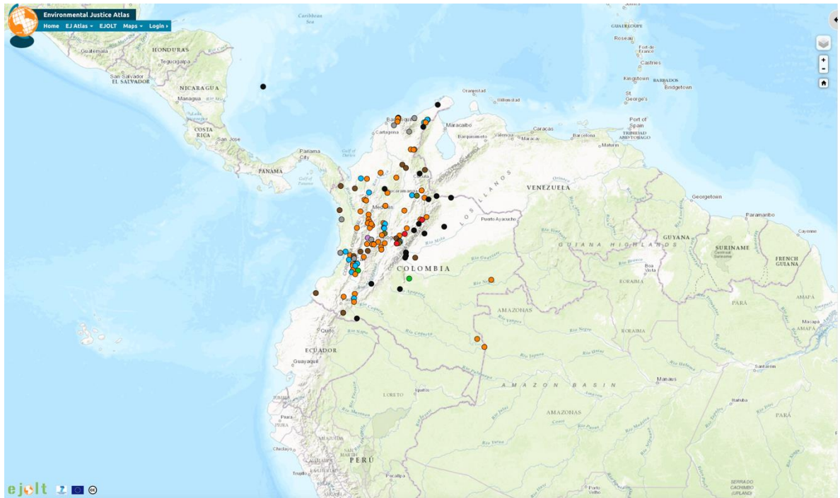
ILUSTRACIÓN 2. Atlas de Justicia Ambiental, Colombia (EJAtlas, 2017)

A continuación se esbozan algunas de esas luchas, y si bien, cada una detenta su temporalidad y una configuración histórico política determinada, se han ido consolidando redes de apoyo y solidaridad entre los actores, para densificar las subjetividades y para amplificar el eco de sus demandas. Una experiencia contagia a la otra, y con el tiempo, a pesar de la violencia interpuesta hacia los mundos de la vida de las comunidades, los fracasos en la lucha, la deconstrucción-construcción y reorganización de las subjetividades, se le ha ido dando forma al movimiento socioambiental colombiano, que intersecta y contiene otras demandas.