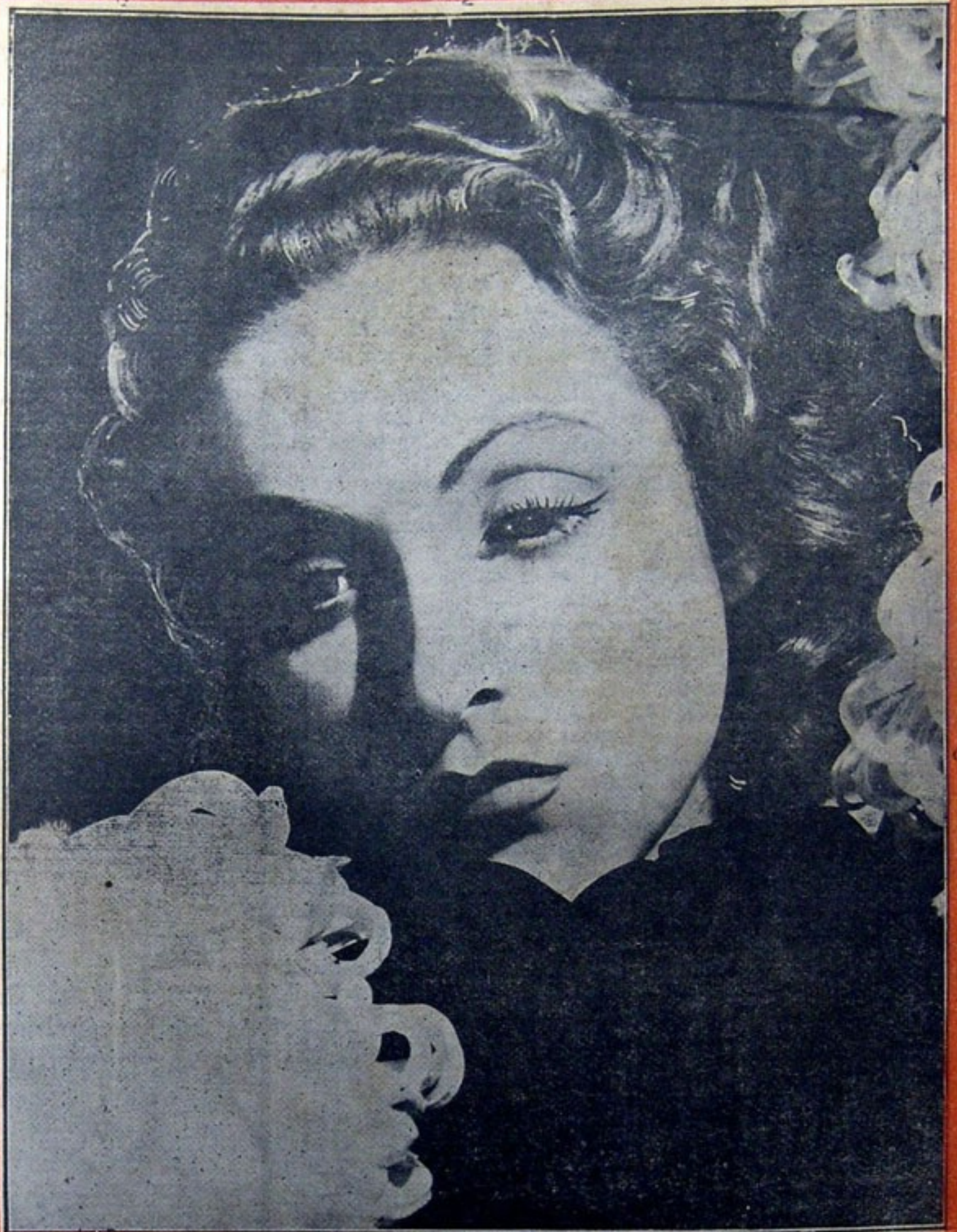
DANIELLE DARRIEUX en "RETORNO AL AMANECER" - JUNIN - Jueves 8 -