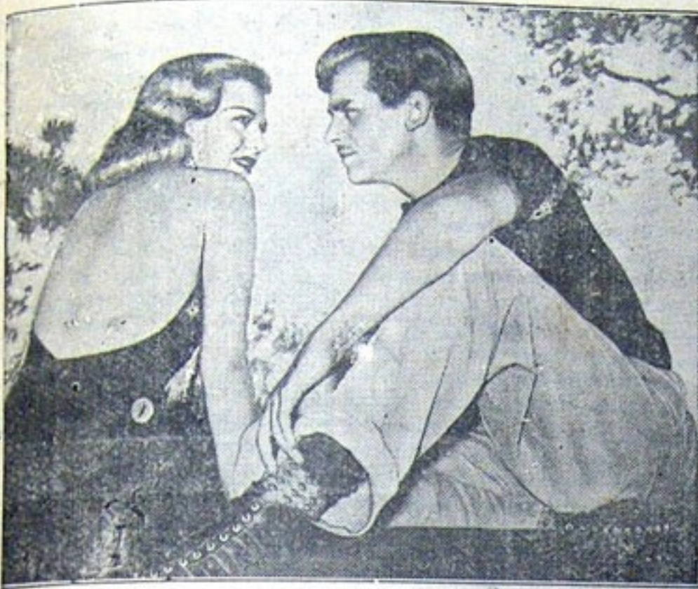
GINGER ROGERS y DOUGLAS FAIRBANKS, Jr. juntos al través de un romance que hará suspirar de emoción a todas las mujeres: "PASION DE VERANO". Romántica! Chispeante! Encantadora! Se estrenará la próxima semana en el JUNIN