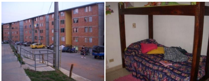
Imagen 1. Observación 1

Habitación de una niña de 12 años de la urbanización Villa Eloísa en San Antonio de Prado Medellín, con un área de 2.5 m x 2.8 m, donde duerme sola.