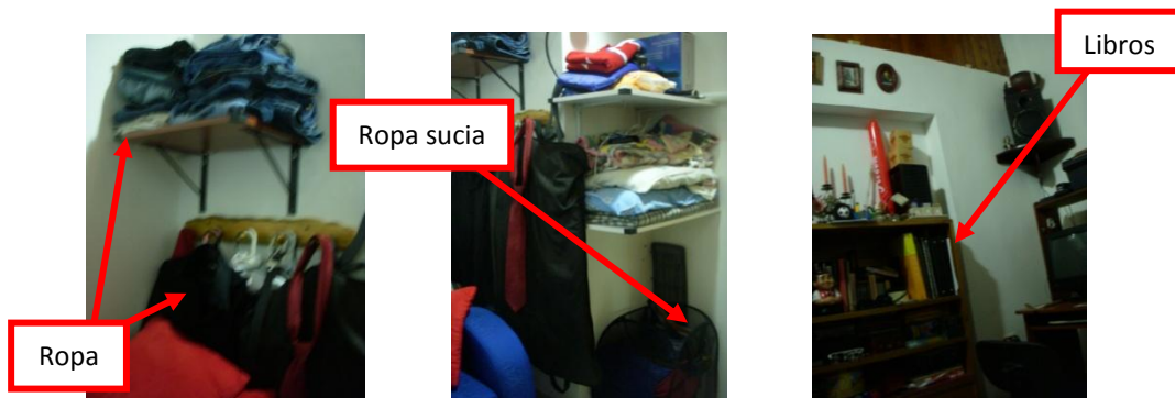
Imagen 6. Problemas Habitación 3