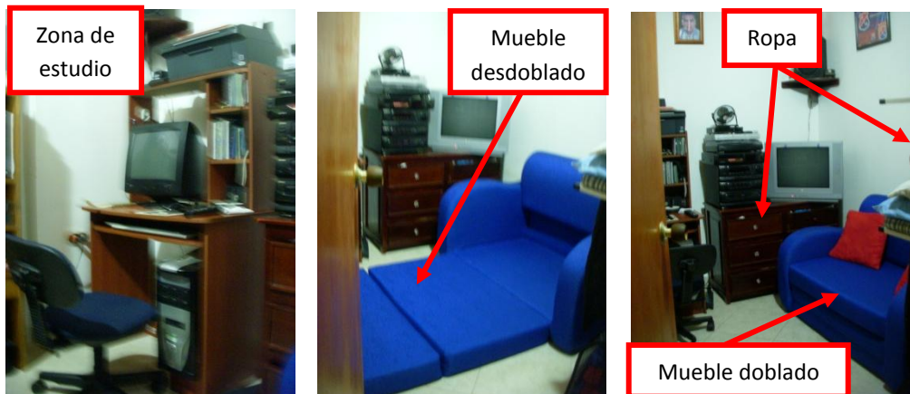
Imagen 5. Observación 3

Habitación de un joven de 28 años de guayabal Medellín, con un área de 2.88 X 2.40m, donde duerme solo.