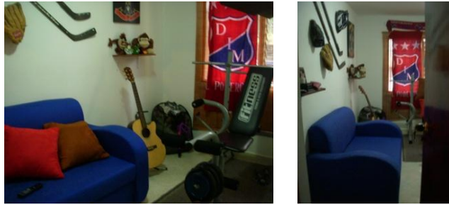
Imagen 3. Observación 2

Habitación de un joven de 23 años de Guayabal - Medellín, con un área de 3.70 X 2.33m, donde duerme solo.