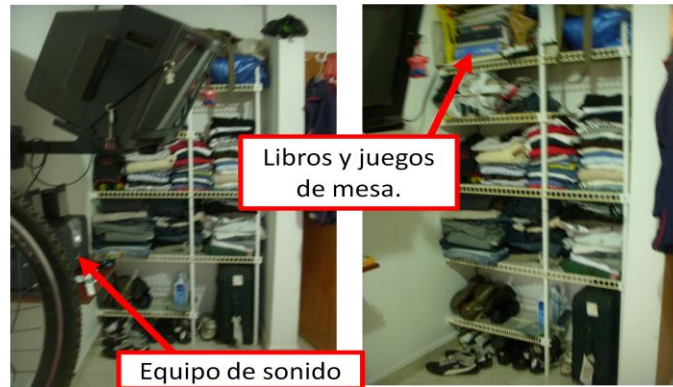
Imagen 4. Almacenamiento Habitación 2