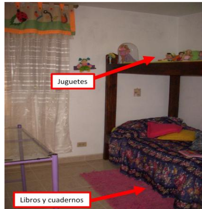
Imagen 2. Habitación 1