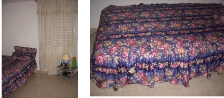
Imagen 7. Observación 4

Habitación de una joven de 26 años de la urbanización Villa Eloísa en San Antonio de Prado Medellín, con un área de 2.5 m x 2.8 m, donde duerme sola.