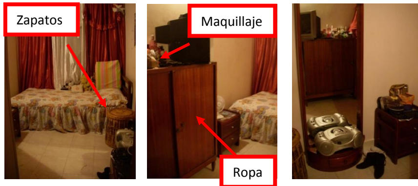
Imagen 11. Observación 8

Habitación de una joven de 19 años de Guayabal-Medellín, con un área de 4 x 2.11 m