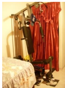
Imagen 9. Closet habitación 5