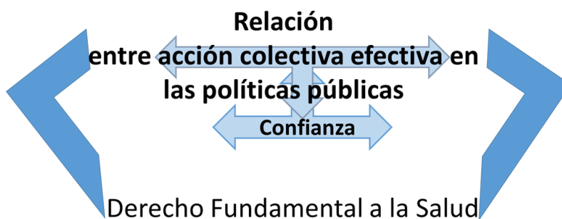
Ilustración 1. Enfoques y categorías

Para el estudio de caso se parte de los enfoques y categorías que han conceptualizado sobre movimientos sociales, especialmente sobre la relación entre la acción colectiva efectiva, basada en la confianza, con las políticas públicas, principalmente con el derecho fundamental a la salud. (Ver Ilustración 1).