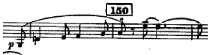
Ilustración 16. Compás 149 con anacrusa. Error de edición en el score.