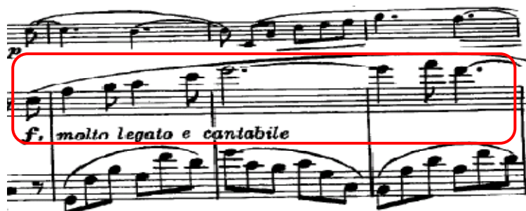
Ilustración 4. Compás 58 con anacrusa.