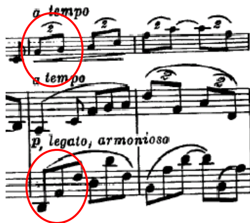
Ilustración 3. Compás 45 con anacrusa.

Además de elementos melódicos provenientes del folklor y las danzas tradicionales sudamericanas, identificamos otro elemento característico en algunas de estas danzas, la polirritmia 2:3. En este caso en particular la melodía cantada por el clarinete fue escrita en dosillos de corchea y la mano izquierda del piano en corcheas agrupadas de a 3 en el marco del compas de 6/8 (Ilustración 3).