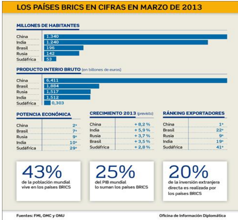
Figura 1. Países BRICS