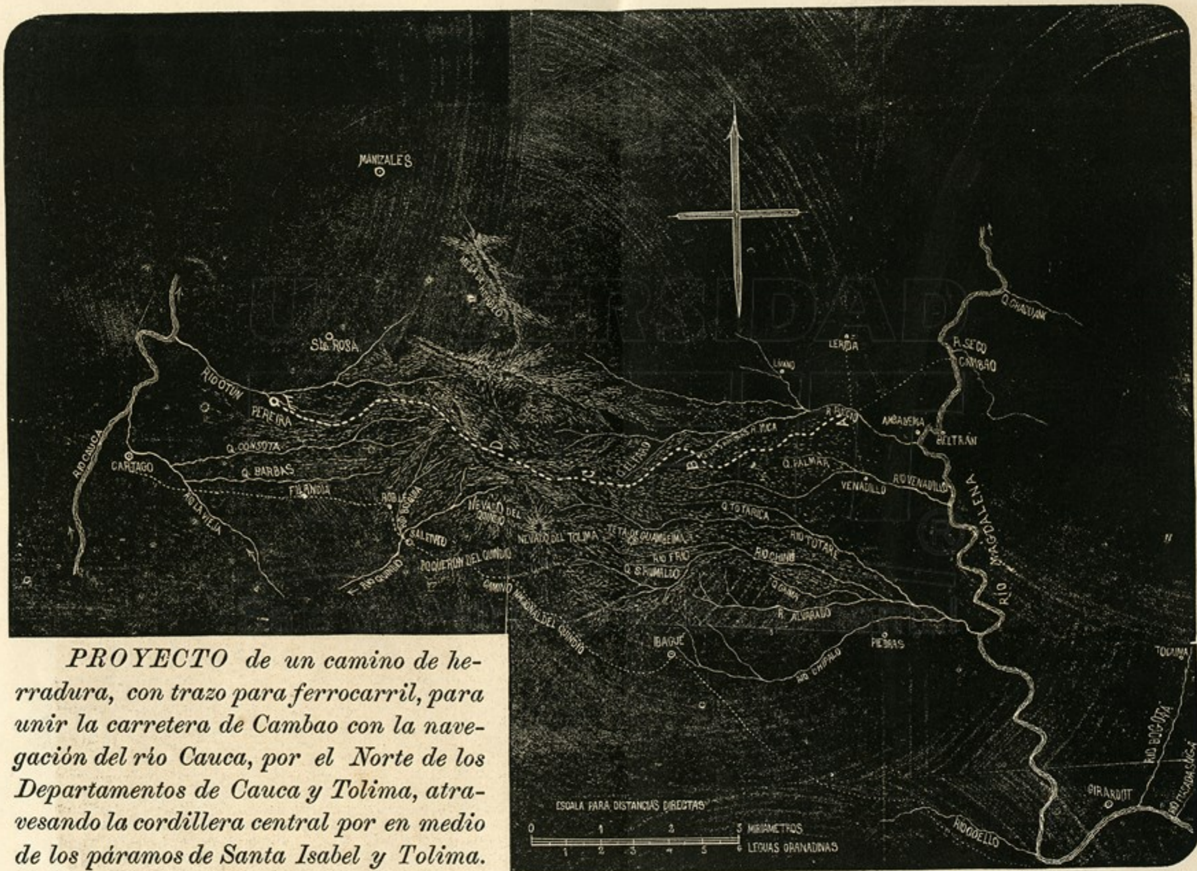
PROYECTO de un camino de herradura, con trazo para ferrocarril, para unir la carretera de Cambao con la navegación del río Cauca, por el Norte de los Departamentos de Cauca y Tolima, atravesando la cordillera central por en medio de los páramos de Santa Isabel y Tolima.

Ibagué, Octubre de 1888.—VICTOR TRIANA C.