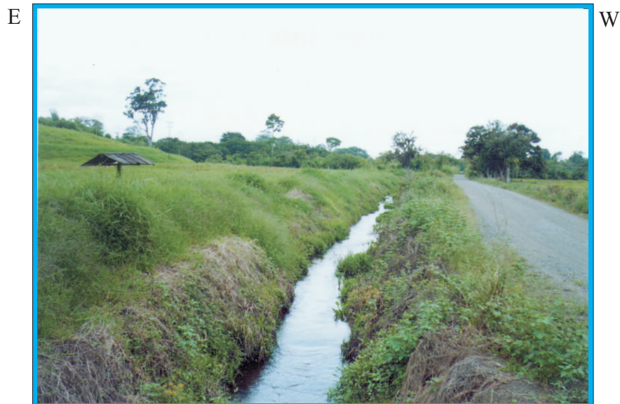
Figura 6: Drenajes en el sector de Planes del Tigre, Hacienda San Felipe. Se encuentran intervenidos por el hombre, que los profundiza y adecua para posibilitar el drenaje.