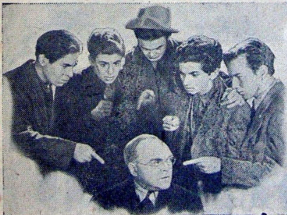
Una interesante escena de "REFUGIO INFERNAL", superproducción que el Junin ha escogido para la celebración del aniversario número trece de Cine Colombia. Se trata de otro éxito con los admirados muchachos de la Pandilla, consagrada en "Angeles con Caras Sucias".

"Las circunstancias de que en la actualidad todos los habitantes del globo estén convencidos de que el cine será la única diversión del futuro, hace que Hollywood sea el centro de atracción para las estrellas de la escena, quienes acuden con el anhelo de encontrar en la pantalla, no como dijera por ahí un bromista, "para verse representar", sino porque se dan cuenta de que el cine les ofrece un campo mucho más amplio