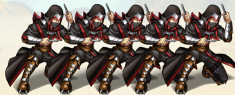
Bots del Clan de las Revistas Depredadoras

Estos cinco bots fueron infiltrados por el Jefe del Clan de las Revistas Depredadoras dentro de la biblioteca como usuarios normales. Su objetivo es confundir a los usuarios, estudiantes e investigadores sobre las buenas prácticas en la investigación, haciendo que se pierdan entre información falsa, trampas y documentos manipulados.